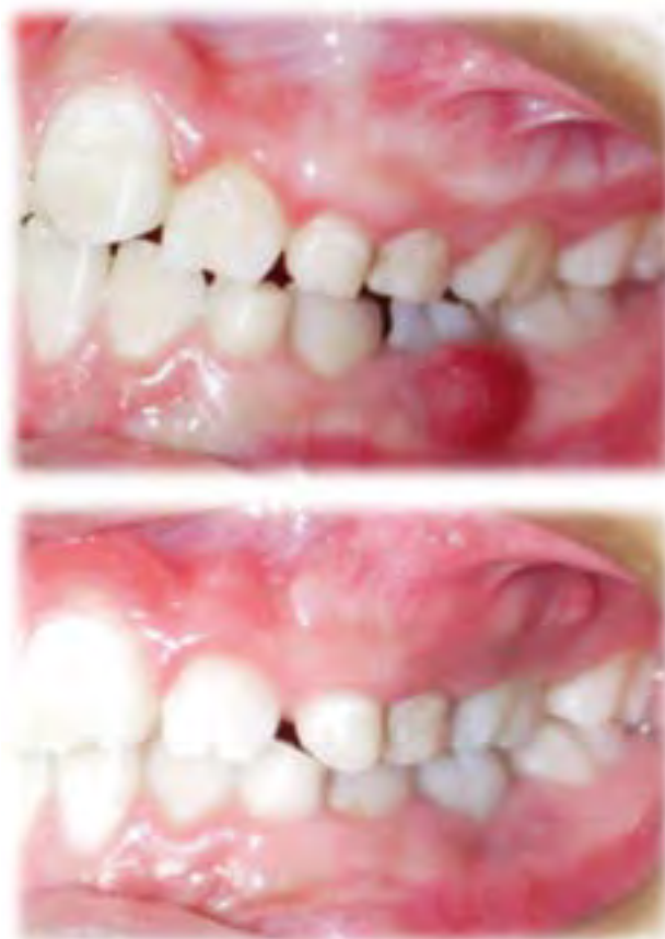
Figura 4. Antes y después de pza. 75 tratada con Pasta Trimix.

Tratamiento aséptico, induce la cicatrización del muñón pulpar. El tratamiento de pulpitis con Pulpotec® es más rápido que la pulpectomía., Evita numerosos fracasos que se han observado con el llamada pulpectomía. La eficacia se fundamenta en un archivo radiográfico de 300