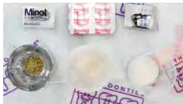
Figura 1. Antibióticos utilizados para la pasta 3Mix: minociclina, ciprofloxacino y metronidazol.

Un grupo de investigadores japoneses desarrolló el concepto de la terapia endodóntica no instrumentada (NIET), empleando una mezcla de fármacos antibacterianos para la desinfección de la pulpa. 11,13 Ellos también apoyan la hipótesis que si hay una esterilización de la lesión podrá producirse la reparación de los tejidos, de ahí nace el concepto denominado esterilización de la lesión y reparación de los tejidos (LSTR). 12