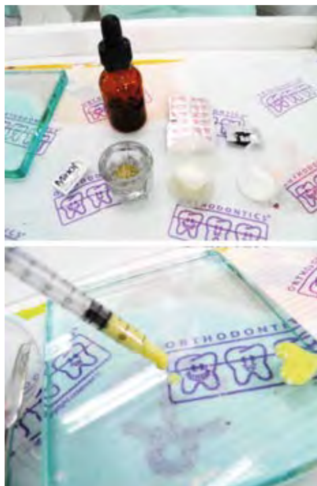
Figura 3. Preparación de la pasta Trimix: Macrogol-propilenglicol/minociclina, ciprofloxacino y metronidazol.