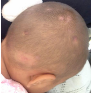
Figura 1. Al examen extraoral se observan cicatrices en región occipital derecha consecuencia del impétigo no ampolloso.