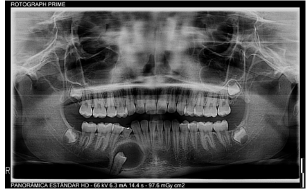
Figura 2. Ortopantomografía en la que se visualiza la retención de la pieza 44 rodeada la corona por una imagen radiolúcida compatible con una patología de características quísticas (siendo confirmado por la anatomía la presencia de un Tumor Odontogénico Adenomatoide). Se observa el desplazamiento de las raíces de la pieza 43 y 45, la íntima relación con el nervio dentario inferior y el orificio mentoniano

Durante el examen cervicofacial no se observaron signos clínicos de relevancia a nivel extraoral. En el análisis intraoral, se detectó a la palpación un abombamiento de la tabla ósea vestibular de la zona anterior de la hemi-mandíbula derecha a nivel de caninos y premolares, indoloro, de consistencia sólida, bordes definidos, sin crepitación, no identificado por la paciente; y en el examen dentario se observó buen estado general, permanencia de la pieza 84 y ausencia de la pieza dental 44 (Figura 1).