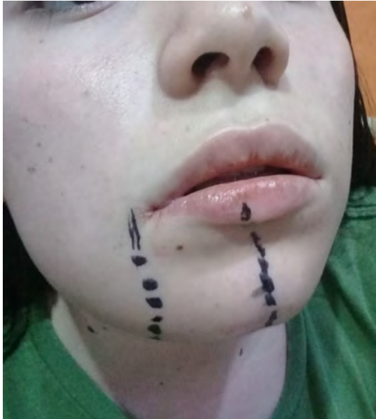
Figura 10. Exploración para demarcar la zona de parestesia mediante la prueba de "pinprick".

sensibilidad del ramo mentoniano en una evaluación 45 días posteriores a la cirugía.