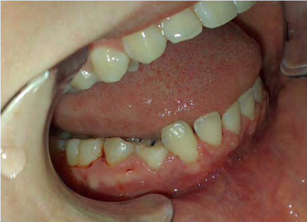
Figura 1. Examen clínico bucal. En la fotografía se puede observar la persistencia de la pieza 84 con ausencia de la pieza 44. Se puede visualizar que no hay cambios de la coloración de la encía o mucosa.

inicio escolar. Se realizó la historia clínica y anamnesis de la paciente.