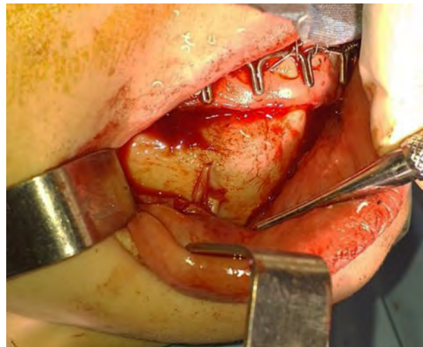
Figura 5. Incisión, legrado y exposición de la salida del paquete Mentoniano. Se puede visualizar que el mismo presenta una bifurcación a la salida por dos orificios.

y escoplo y pinza gubia. Creada la ventana de acceso a la lesión (Figura 6) se procedió a la divulsión roma o legrado de la misma, y resección completa en conjunto con la pieza dentaria 45, toilette de la cavidad residual (Figura 7) con solución fisiológica estéril atemperada, regularización de márgenes óseos, reposición del colgajo y sutura continua con vycril 4/0 (Figura 8).