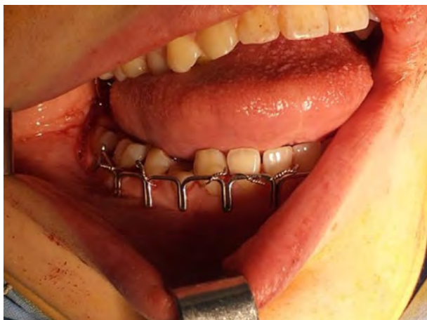
Figura 4. Instalación de arcos peines en el maxilar inferior, para prevención de una fractura patológica intraquirúrgica o posquirúrgica.