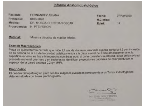
Figura 11. Estudio de Anatomía Patológica con el resultado de TOA o Tumor Odontogénico Adenomatoide.

Se hizo un seguimiento de control a distancia hasta 10 meses, en donde se observa radiológicamente la remodelación