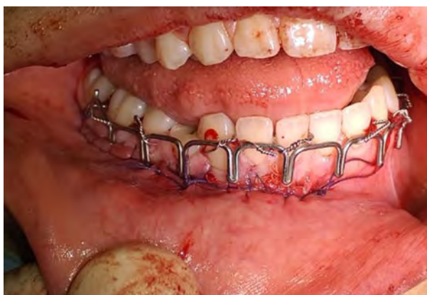
Figura 8. Cierre con sutura vycril 4/0.

Se administró por vía endovenosa analgésico (fentanilo 200 mgr) y antibiótico (cefazolina 2 gr.), continuando por vía oral con cefalexina 1 gr, y flurbiprofeno 200 AP.