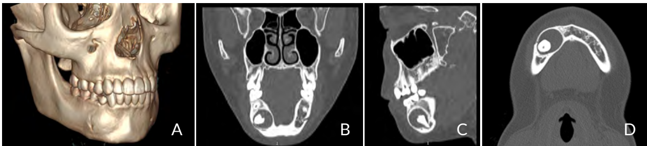
Figura 3. Tomografía Computada. En la imagen A de reconstrucción 3d se visualiza el soplamiento de la tabla vestibular y la salida del conducto mentoniano. En la imagen B se observa el adelgazamiento de la tabla vestibular y lingual con el soplamiento que realiza la lesión en sentido V-L. En las imágenes C y D se observa el íntimo contacto con el conducto mentoniano.

Se realizó ortopantomografía de rutina, y se observó en el hemi-maxilar inferior derecho, entre las piezas 43 y 45 una lesión radiolúcida unilocular, circunscrita por un borde óseo esclerótico bien definido, de 20 mm por 18 mm, con su límite inferior próximo a la basal mandibular, desplazamiento radicular de las piezas contiguas, envolviendo la corona de la pieza 44 incluida (Figura 2). Se solicitó TAC de macizo cráneo-facial, para la planificación del abordaje quirúrgico y evaluar relación con estructuras nobles (Figura 3 A,B,C y D).