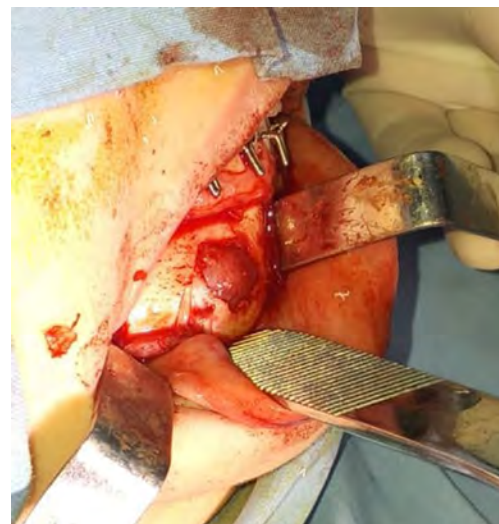
Figura 6. Ostectomía vestibular, exposición del polo externo de la lesión tumoral.