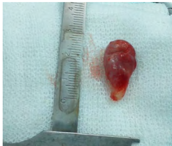
Figura 9. Visualización del Tumor Odontogénico Adenomatoide o TOA de 1,7cm de diámetro e inclusión de la pieza 44.