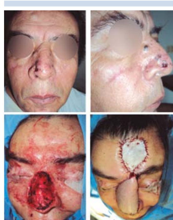
Figura 8. Síndrome de Gorlin-Goltz.