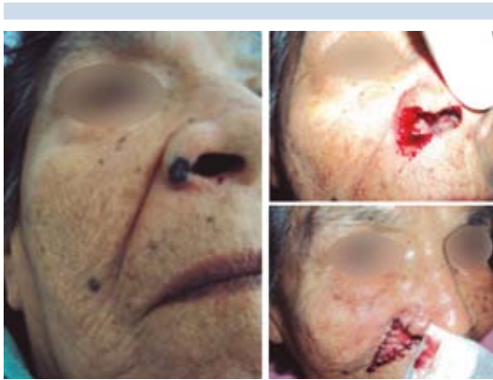
Figura 9. Carcinoma basocelular en nariz.

Paciente masculino de 46 años de edad con cáncer epidermoide de paladar. Se le realizó maxilectomía total con preservación del piso orbitario y se le colocó obturador. Casos iguales a éste: 3 (Figura 10).