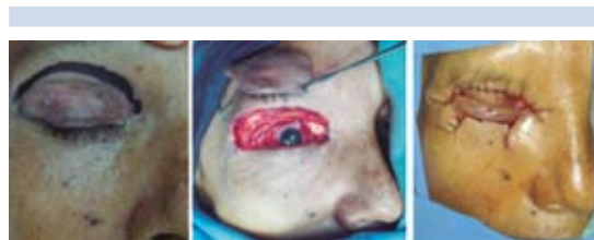
Figura 3. Metástasis de cáncer cervicouterino a párpado.

Paciente de 45 años de edad, con diagnóstico de hemangioma de la región temporal; se le realizó resección quirúrgica y reconstrucción con colgajo microvascular. Casos tratados: 1 (Figura 4).