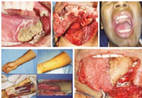
Figura 2. Carcinoma epidermoide de lengua.

respuesta clínica completa; tuvo metástasis única a párpado. Se realizó la resección del párpado y su reconstrucción. Casos tratados: 2 (Figura 3).