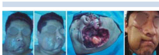
Figura 12. Hemangioma facial.