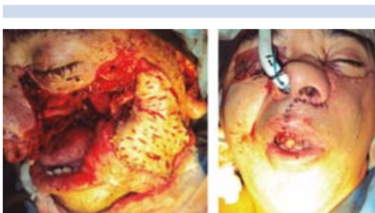
Figura 10. Carcinoma epidermoide de paladar.