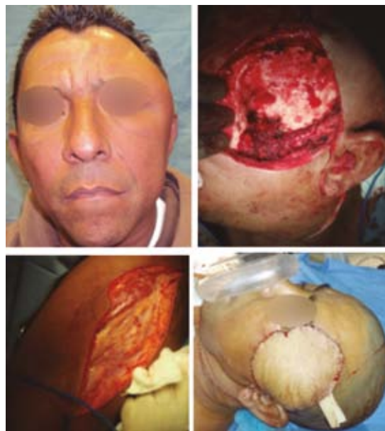
Figura 4. Hemangioma de la región temporal.