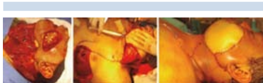
Figura 5. Carcinoma de mucosa bucal.

Paciente femenina de 85 años de edad, con carcinoma mucoepidermoide de la parótida; se