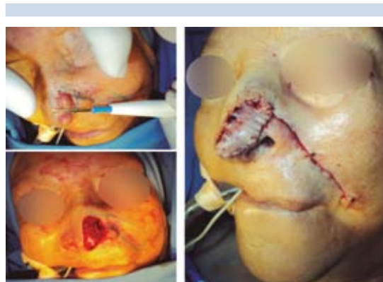
Figura 11. Carcinoma basocelular en la punta de la nariz.

De los 37 casos tratados con este tipo de reconstrucciones, un paciente falleció debido a recaída