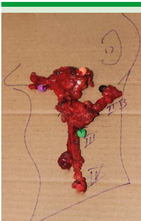
Figura 5. La disección cervical facial permite la resección en monobloque de todos los ganglios del cuello (en esta foto se muestran niveles IA a IV; disección antero-lateral).

los que se les había hecho reconstrucción con colgajos libres o pediculados.