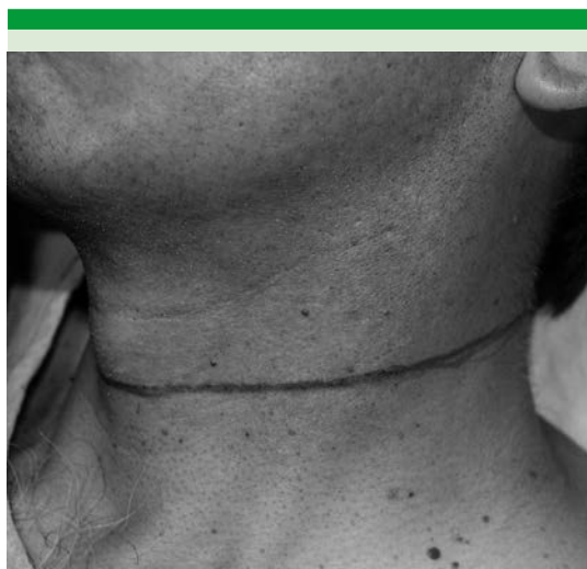
Figura 2. Diseño de incisión cervical transversa única para disección radical modificada de cuello izquierdo.

La incisión cervical única transversa permite dejar huella mínima en el cuello y acceder a los cinco niveles ganglionares, evitando secuelas estético-funcionales como otro tipo de incisiones lo hacen, sobre todo las que combinan incisiones verticales y horizontales (Sibileau-Careaga, Martin, Paul-André, etc.). Figura 3