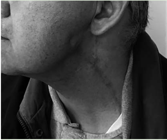
Figura 3. Las incisiones verticales producen contractura, cicatriz queloide y secuelas que afectan la calidad de vida del paciente.

El objetivo de este artículo es comunicar nuestra experiencia con este tipo de incisión en pacientes a los que se les hizo disección radical modificada de cuello.