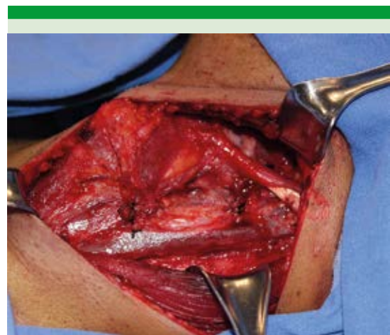
Figura 6. La incisión transversa permite la exposición adecuada de todos los niveles cervicales.

La incisión cervical transversa ofrece la combinación satisfactoria entre disección ganglionar en número de ganglios disecados y de niveles cervicales, con adecuado resultado estético ( Figuras 6 y 7 ), permite el abordaje a todos los niveles de cuello y ofrece, incluso a pacientes