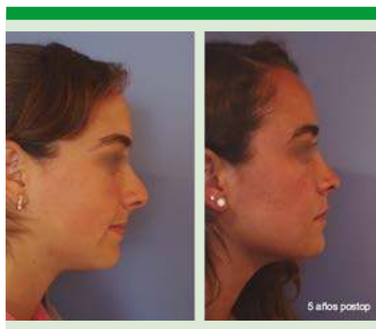
Figura 5. Fotografía que muestra cambios faciales cinco años después de la operación.