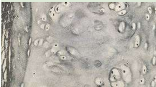
Figura 5. Micrografía de cartílago septal conservado en solución salina a 0.9% durante 90 días. Se observa en la parte central superior cromatolisis local con lagunas sin núcleo, el resto del cartílago se encontró en general bien conservado (H-E 160X).