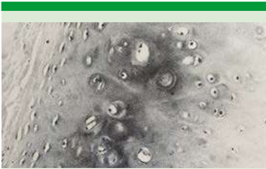
Figura 3. Micrografía de cartílago septal con caracteres histológicos normales (H-E 100X).