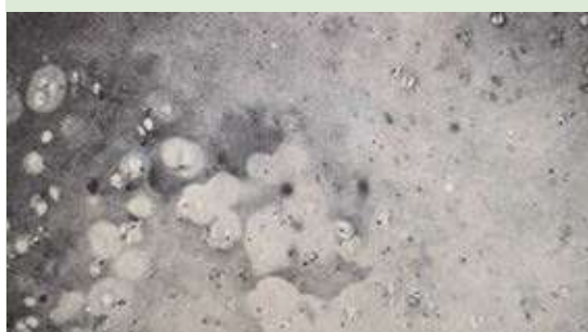
Figura 8. Micrografía de cartílago septal conservado en merthiolate blanco al 1:1000 durante 60 días. Se observa cromatolisis celular difusa (H-E 63X).

La refrigeración estándar a 5°C se llevó a cabo en un refrigerador casero, de ahí la facilidad de poder conservar nuestro banco en el consulto-