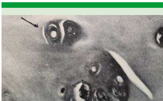
Figura 7. Micrografía de cartílago septal conservado en merthiolate blanco al 1:1000 durante 30 días. Se observa degeneración vacuolar escasa (flecha) [H-E 400X].