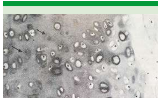
Figura 6. Micrografía de cartílago septal conservado en solución salina a 0.9% durante 365 días. Se observa cromatolisis mínima (flecha). El resto de cartílago en general bien conservado (H-E 160X).