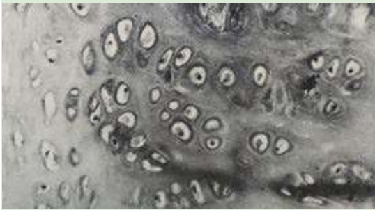
Figura 4. Micrografía de cartílago septal conservado durante 30 días en solución Hartmann en el que no se observan alteraciones histológicas (H-E 160X).