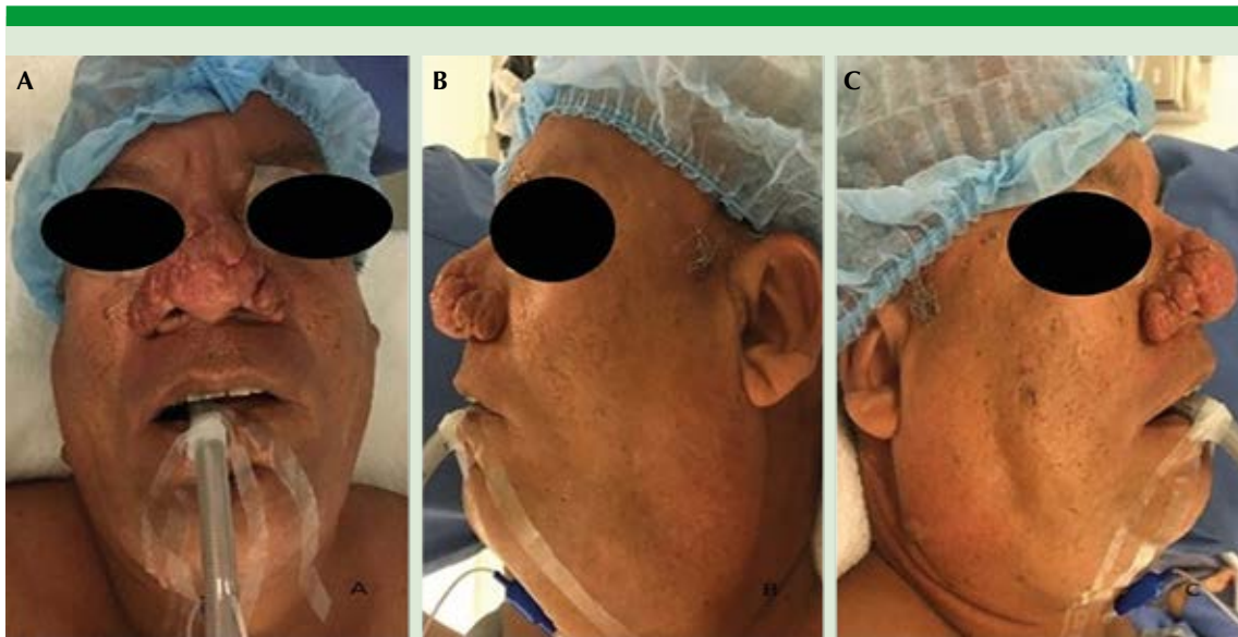
Figura 1. Fotografías frontal (A), lateral izquierda (B) y lateral derecha prequirúrgicas (C).

sanguíneos superficiales corroborando el diagnóstico de rinofima, no se reportó malignidad. En la primera y segunda semanas posquirúrgicas se evaluó el proceso de cicatrización por segunda intención. Se le indicó realizar diariamente lavados con agua y jabón neutro cada 8 horas seguido de aplicación de mupirocina a 2% en las zonas de resección y evitar la exposición solar, a las 6 semanas posquirúrgicas se observaron cambios ( Figura 2 ). El paciente reportó un periodo posquirúrgico sin dolor, satisfacción con los resultados cosméticos, mejoría en la autopercepción y reanudación de su actividad social habitual.