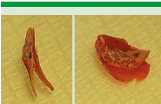
Figura 3. Injerto de doble fascia preparado previa colocación.

en el sitio de la perforación mediante un doblez de la capa interna introduciendo esa capa a través de la perforación con ayuda de una pinza caimán, una vez dentro de la caja se acomodó el injerto, dejando una capa de fascia medial a la membrana timpánica y la otra lateral, ambas extendidas cubriendo la totalidad de la perforación. Por último, se colocó un tapón metal