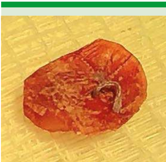
Figura 2. Injerto de doble fascia con punto de vicryl central antes de completar el corte de los bordes.