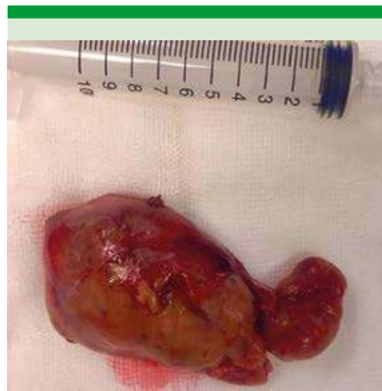
Figura 2. Paratiroides inferior izquierda. Fotografía de la pieza quirúrgica.

A pesar de que en la actualidad el diagnóstico de hiperparatiroidismo es esencialmente por hallazgos de laboratorio en pacientes asintomáticos, también puede manifestarse en la forma clásica. Muchos de estos pacientes cursan con una evolución prolongada, debido a que no se investiga más allá de un padecimiento tan común como la infección de las vías urinarias, como el caso de nuestra paciente. Esto concuerda con algunos estudios latinoamericanos,