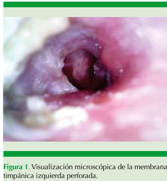
Figura 1. Visualización microscópica de la membrana timpánica izquierda perforada.

La tomografía de mastoides mostró una lesión en el ápex petroso izquierdo asociada con