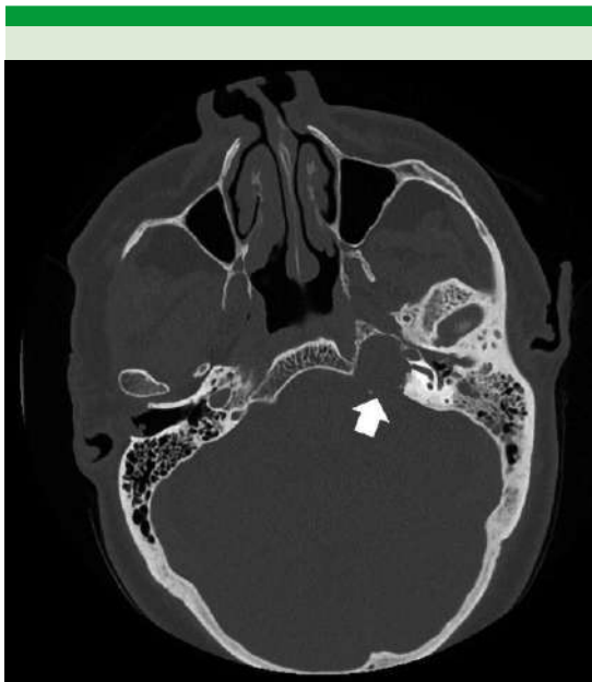
Figura 2. Tomografía computada que evidencia una tumoración en el ápex petroso (flecha blanca) con destrucción ósea y pérdida de neumatización del mastoides.

que reveló fragmentos de queratina compatible con colesteatoma.