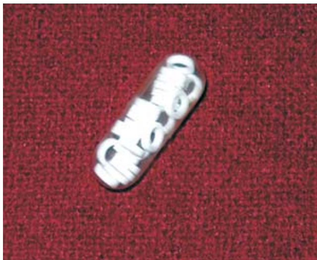
Figura 1. Marcadores radioopacos comerciales.

mentos colónicos en las radiografías mediante el marcaje de líneas determinadas por límites óseos (crestas ilíacas, apófisis espinosas y pelvis), una línea vertical trazada sobre los procesos espinosos de las vértebras y hasta la 5a. vértebra lumbar, la segunda línea de la 5a. vértebra lumbar hacia espina ilíaca anterosuperior derecha y la 3a. línea de la 5a. vértebra lumbar hacia la cresta ilíaca izquierda, para dividir el colon en tres segmentos: Colon derecho, colon izquierdo y rectosigmoides. El número total de marcadores en cada segmento se utilizó para obtener el tiempo de tránsito colónico. Se tomó como tiempo de tránsito colónico prolongado un tiempo mayor de 72 horas y de acuerdo con el segmento afectado se clasificó a los pacientes en inercia colónica o estreñimiento obstructivo.