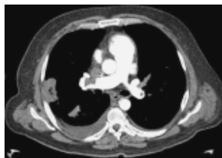
Figura 4. Defecto de llenado a nivel de los vasos sanguíneos, paralelos a los cortes axiales.