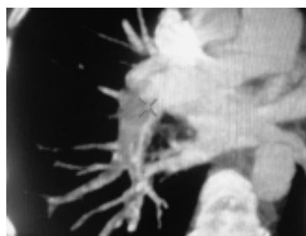
Figura 3. Signos secundario, extensión bronquial y a vasos colaterales acompañando un patrón de perfusión.