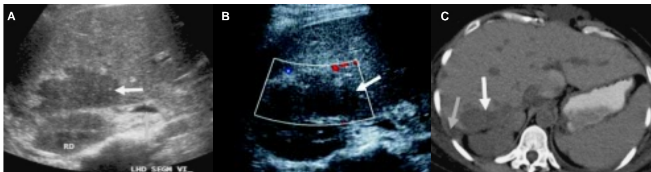
Figura 4. Fuga biliar. A,B) US colección anecoica en hilio. C) TC zona hipodensa mal definida en a nivel del hilio. D) CPRE fuga del medio de contraste a nivel de anastomosis.

Es importante evaluar el flujo de la vena porta desde el nivel de la anastomosis hasta su bifurcación, así como la velocidad en este trayecto ( Cuadro I ).