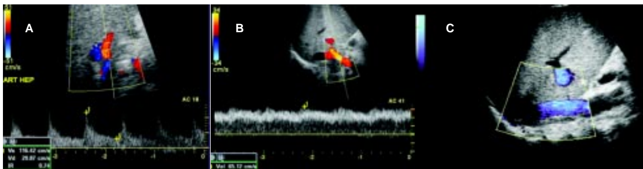
Figura 1. Evaluación Doppler color y poder de injerto hepático. A) Arteria hepática, B) Vena porta, C) Vena cava inferior.