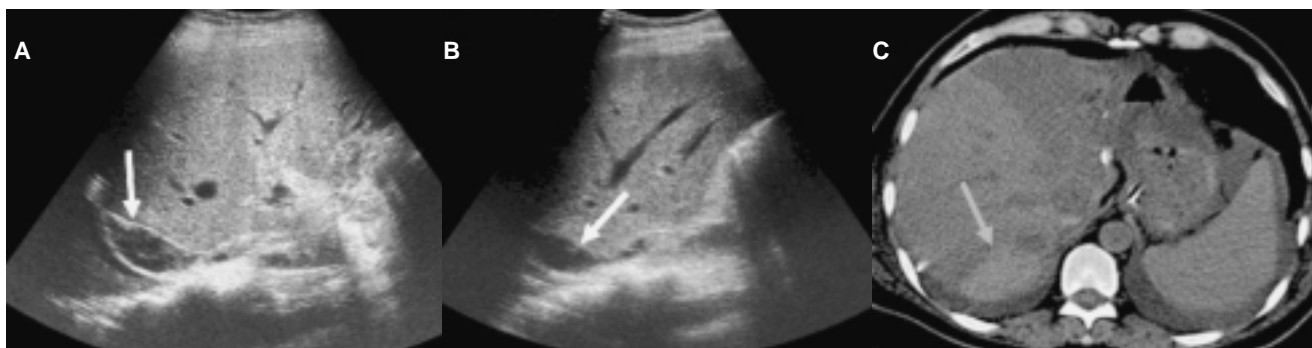
Figura 2. Hematoma en segmento VI, A,B) Colección anecoica, heterogénea con múltiples ecos en su interior. D) Tomografía simple, corte axial, con zona hiperdensa en relación con sangrado.

sentan datos indirectos de rechazo, isquemia, hepatitis o colangitis; los focales pueden corresponder a hematomas, abscesos, infartos y de manera tardía neoplasias.