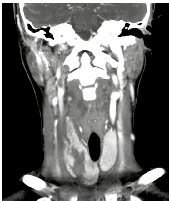
Figura 2. Reformateo en coronal: extensión de la lesión. No se documentaron lesiones vasculares.

rotura tiroidea. En algunos casos, debido al gran aporte sanguíneo de la glándula, puede haber formación de un gran hematoma. 1-6 Los síntomas varían desde un proceso poco sintomático hasta síntomas que pueden producir un estrés respira-