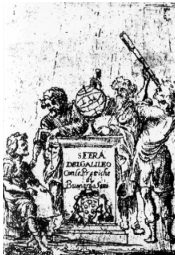
FIG. 2: Apuntes del curso de Galileo sobre la esfera.

La nueva anatomía y los antecedentes de la doctrina circulatoria aparecen vinculados principalmente a dicha universidad véneta. Pero en ésta se daba aún gran importancia a las obras de Aristóteles y a las de Galeno. La influencia de tales personajes aparece siempre presente en figuras destacadas del avance científico de la época. Todos deseaban la corrección de los errores que adulteraban los textos clásicos, mas nadie pensó en desechar o reemplazar a los antiguos. 8 Por lo que atañe a Harvey, éste se consideró aristotélico y galenista hasta el fin de sus días. El descubri-