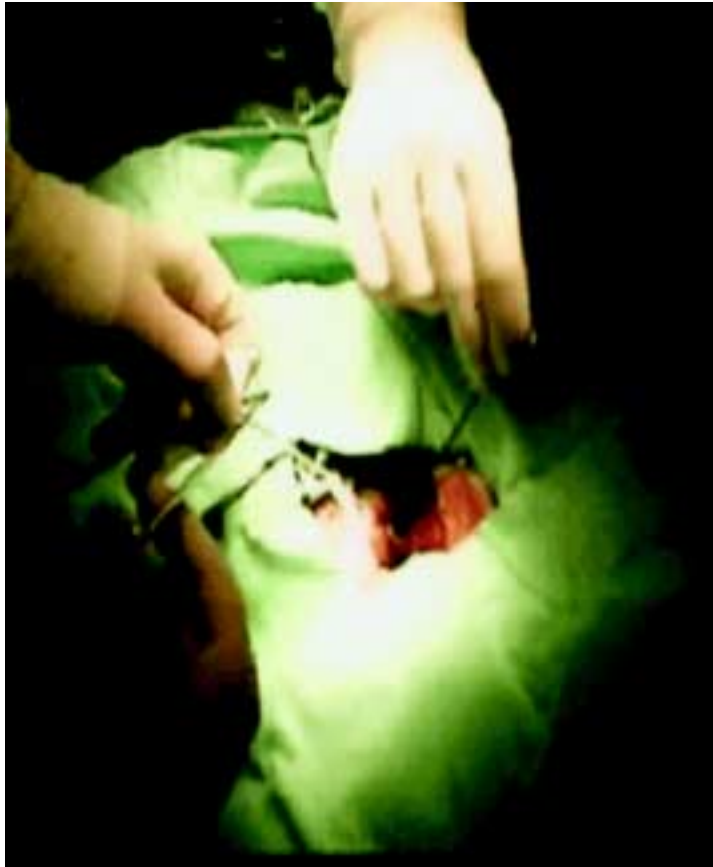
Fig. 1. Introducción de catéter por atriotomía, apéndice auricular derecho.