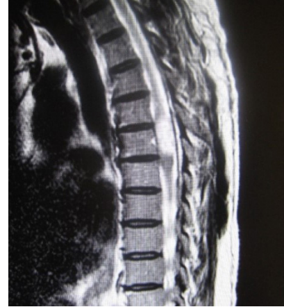
Figura 3. Mielo RMN sagital donde se observa ausencia de señal a nivel de la lesión.

Figura 2. RMN T2 en corte sagital, que muestra la lesión ocupativa ovoide hipertensa en el nivel T6.