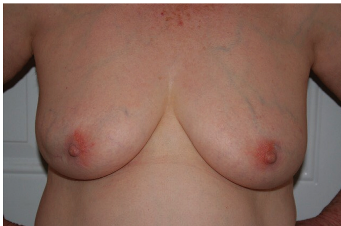
Imagen Aten Fam 2017;24(2):93-94.

Paciente femenino de 66 años de edad, casada, múltipara, obesa, con antecedente de alcoholismo social. Acude con su médico familiar para su valoración por presentar cuadro de seis meses de evolución caracterizado por enrojecimiento e induración generalizada de la glándula mamaria derecha, dolor y hundimiento del pezón.