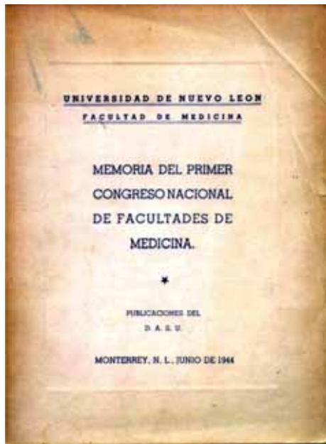
Figura 1. Portada del libro: Memorias del Primer Congreso Nacional de Facultades de Medicina. Junio de 1944.