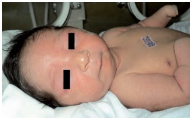
Figura 1. Estrechez bitemporal, frente estrecha, glabella prominente, reborde supraorbitario horizontalizado, cejas horizontalizadas y semipobladas, telecanto, fisuras palpebrales cortas, puente nasal plano, nariz corta con narinas antevertidas, filtrum largo y semiborrado, boca pequeña, labios delgados, micrognatia.

Se conoce que el abuso de cocaína en el embarazo produce defectos congénitos en 15-20% de los casos y afecta principalmente el desarrollo de órganos como cerebro, corazón, tracto genitourinario y extremidades. 2,24 Se han descrito el peso, la talla y el perímetro cefálico por debajo del percentil 25, con facies caracterizada por estrechez bitemporal, implantación baja de cabello, reborde supraorbitario horizontal, glabella prominente, fisuras palpebrales cortas y nariz corta con narinas antevertidas. 8 Las mujeres embarazadas que consumen cocaína a menudo lo hacen en combinación con alcohol, tabaco, marihuana, opiáceos y otras drogas ilícitas (mujeres denominadas poliusuarios), 17,18 lo que hace difícil determinar los efectos congénitos de estas sustancias en el feto y en el recién nacido. 8,9