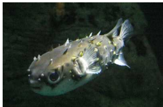
Figura 6.- Pez Globo pequeño.

Se ha demostrado que su veneno llamado tetrodotoxina tiene efectos analgésicos muy efectivos por lo cual se ha estudiado y este producto se encuentra en segunda etapa del estudio, los resultados son favorables ya que no producen efectos secundarios puesto que es un analgésico natural. Hasta la fecha se ha probado en siete ciudades diferentes de Canadá y también se está utilizando en las clínicas de China 11,16 .