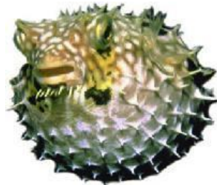
Figura 5.- Pez Globo usado como lámpara.

general, sensación de luminosidad o estar flotando, hormigueo, bradicardia, pérdida de reflejo pupilar, ataxia, cefalea, dolor abdominal, diarrea, vómito y parálisis musculares, al comenzar la parálisis ascendente se manifiesta el shock cardiovascular y el paro respiratorio llegando a la muerte lo cual puede ocurrir de 6 a 24 horas después de la intoxicación 3 .