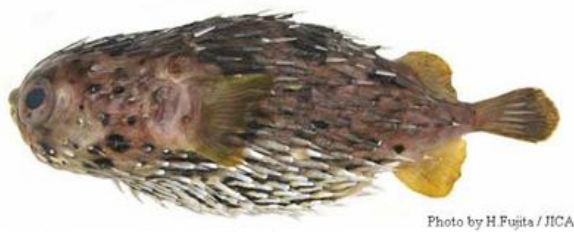
Figura 2.- Pez Globo vista lateral.