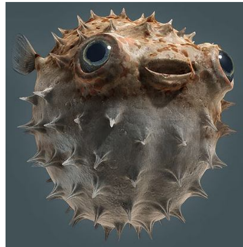
Figura 3.- Pez Globoextendido.