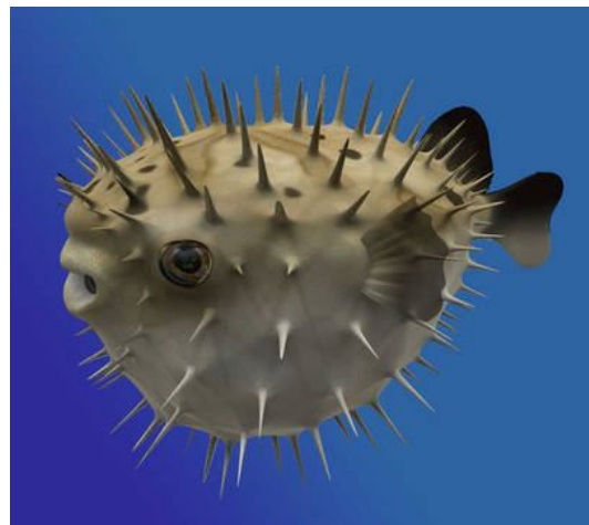
Figura 7.- Pez Erizo.

Actualmente las intoxicaciones por consumo de pez globo se han reducido importantemente ya que solo pueden prepararlo personas que han recibido un curso especializado 13,14,16,17 .