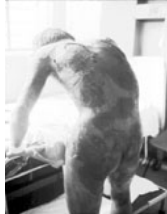
Figura 4. Paciente con necrólisis epidérmica tóxica, el cual con el permanganato de potasio muestra mejoría de las zonas denudadas.

dependiendo de los resultados de los estudios de laboratorio y de las condiciones hemodinámicas, en caso necesario se les administró albúmina, paquetes globulares, plasma fresco, plasma rico en plaquetas, crioprecipitados o concentrados plaquetarios. El tratamiento específico para la necrólisis epidérmica tóxica se dividió en tres fases: