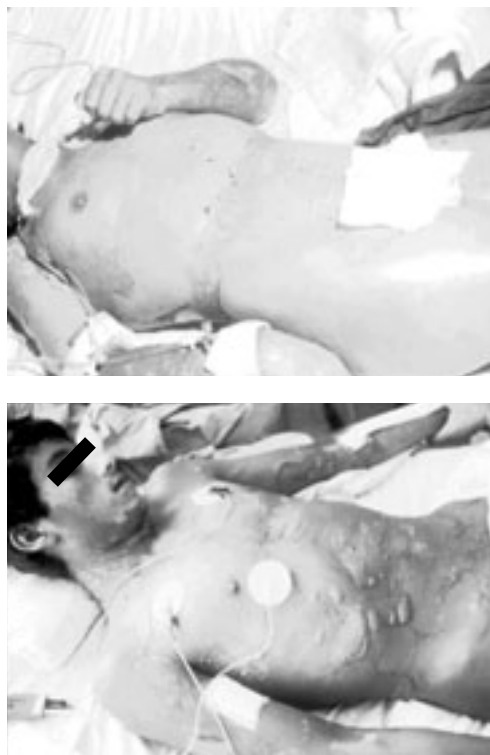
Figura 2. Pacientes de uno y otro sexo, en quienes se observan ampollas de diferente tamaño que abarcan la totalidad de la superficie corporal, correspondientes a necrólisis epidérmica tóxica grave.

Mucho de lo anterior era desconocido por los autores que han publicado casos de necrólisis epidérmica tóxica, y la base del tratamiento era bloquear la respuesta inflamatoria con esteroides como la hidrocortisona, dexametasona y metilprednisolona. Sin embargo, cuando se hace el análisis de la muerte de estos pacientes se encuentra que generalmente ocurre por infecciones por gérmenes oportunistas como Staphylococcus o enterobacterias, ya que los pacientes se encuentran inmuno-