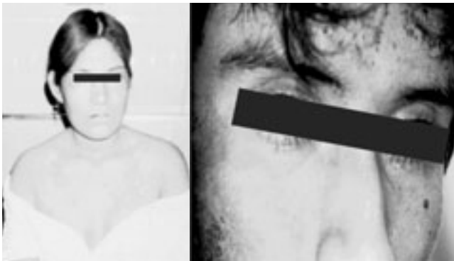
Figura 5. Fotografías de los dos pacientes de la fotografía 2, a los 20 días de tratamiento. Se nota recuperación total de la epidermis.

Todos los pacientes fueron sometidos a técnicas de aislamiento. Se les administraron sustancias coloides y cristaloides