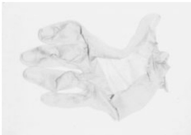
Figura 1. Guante epidérmico que se desprendió de la mano de un paciente (signo de Nykolsky).

la mortalidad, ya que en la forma benigna era menor a 50 % y en la forma maligna ocurría en 100 %; generalmente esto se debía a choque hipovolémico por deshidratación, alteraciones hidroelectrolíticas y falla de órganos vitales, asociadas a infección.