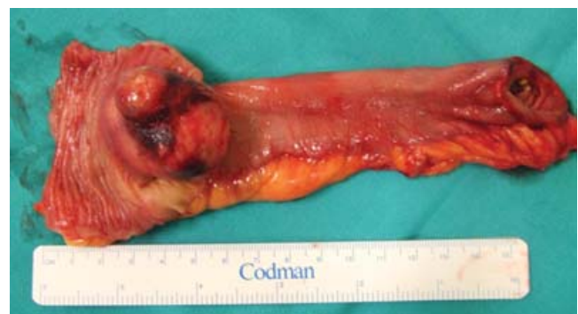
Figura 2. Pieza quirúrgica que muestra la ulceración de la mucosa intestinal.

Su forma principal de presentación es la hemorragia digestiva. El tratamiento de elección es la resección quirúrgica con márgenes apropiados, sin necesidad de linfadenectomías, ya que