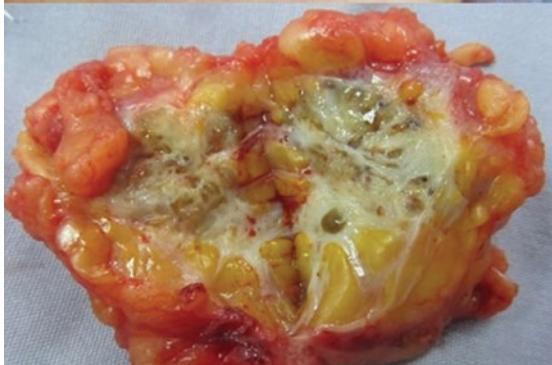
Figura 3. Escisión de endometrioma de pared abdominal.