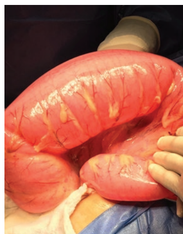
Figura 2. Hallazgos transoperatorios. Vólvulo de sigmoides con distensión proximal de asas intestinales y lesión mesentérica.