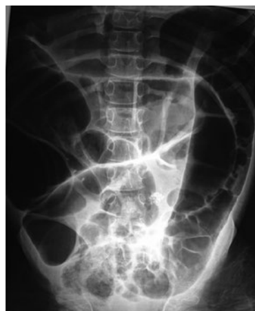
Figura 1. Radiografía simple de abdomen. Distensión generalizada de asas intestinales con edema secundario y ausencia de aire distal.