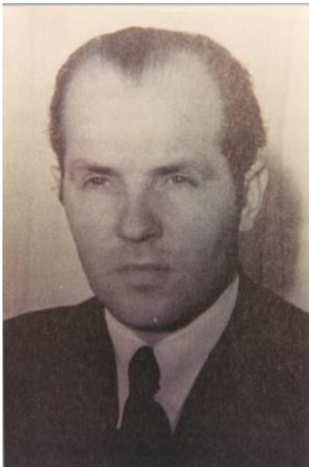
Fig. 1. Vladimir P. Demikhov.

y bioterios al mejor entendimiento de la fisiología cardiovascular en el afán de poder desarrollar alternativas terapéuticas con los limitados recursos existentes en la época para tratar la patología que aquejaba a sus pacientes. Entre 1940 y 1960 en la entonces Unión Soviética, Demikhov inició una serie de experimentos muy ingeniosos que demostraron la posibilidad técnica de realizar trasplantes intratorácicos y otra serie de operaciones cardiopulmonares futuristas para la época. 1 Presentamos un resumen biográfico de tan legendario cirujano y una semblanza del trabajo pionero que sentó las bases de la cirugía cardiorrástica moderna.