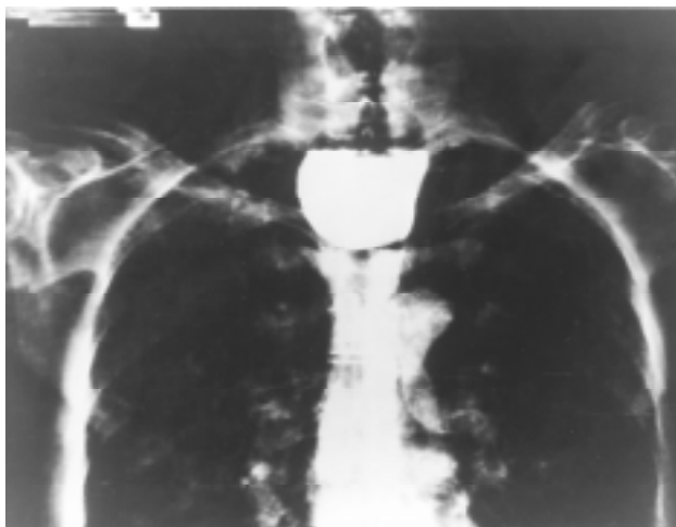
Fig. 1. Esofagograma: deglución de bario, el cual muestra el divertículo de gran tamaño.