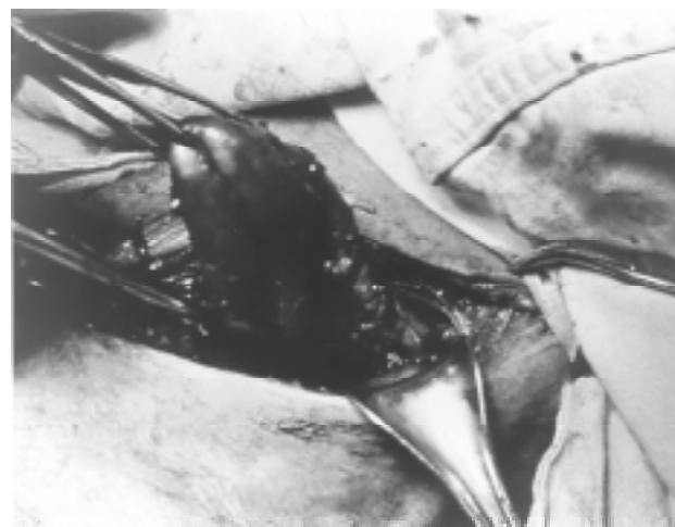
Fig. 3. Disección del saco diverticular hasta el espacio de Killian.