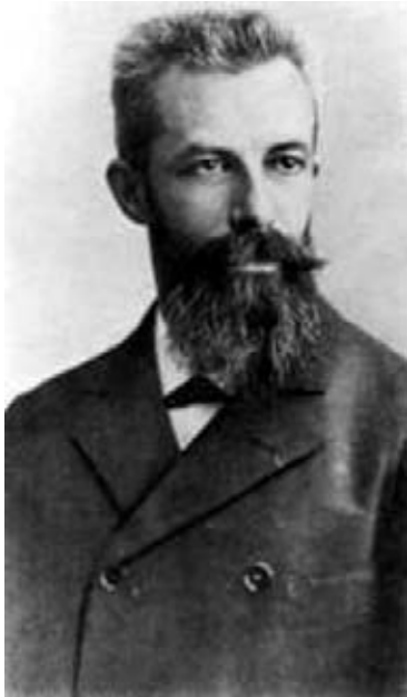
Fig. 1. Henri Albert Hartmann.