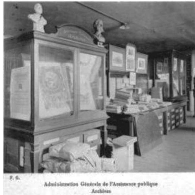
Fig. 4.

Por los grandes esfuerzos y aportaciones, al doctor Hartmann le fueron otorgados varios títulos, reconoci-