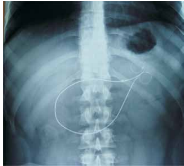
Fig. 3. Prótesis Endosphere colocada en arcada duodenal.

Ramos y Escalona, en Brasil y Chile, respectivamente, ponen en marcha el protocolo de un dispositivo reversible, colocado por endoscopia hecho con nitinol y que des-