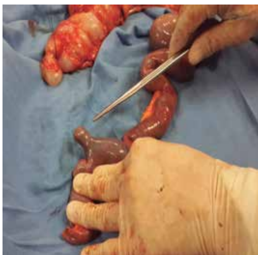
Figura 2. Hemicolecotomía derecha hasta 110 cm del íleon.

Su origen embriológico resulta de obliteración incompleta del conducto onfalomesentérico o vitelino aproximadamente en la séptima semana de gestación, y normalmente se encuentra a 100 cm de la válvula ileocecal. 4 El diagnóstico de un divertículo de Meckel complicado es difícil por su capacidad de simular otras patologías como apendicitis, colecistitis, enterocolitis, enfermedad de Crohn o diverticulitis colónica, y debería ser considerado en pacientes con dolor abdominal crónico, sangrado de tubo digestivo u obstrucción intestinal o abdomen agudo de origen inexplicable. 5