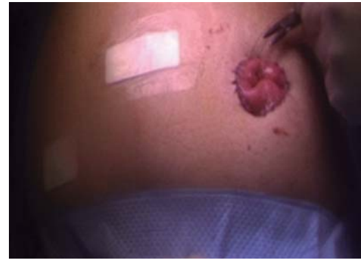
Figura 4. Colostomía en asa realizada por laparoscopia.

Es claro que aquellos pacientes con enfermedad sistémica al momento del diagnóstico deberán ser tratados conservadoramente, con