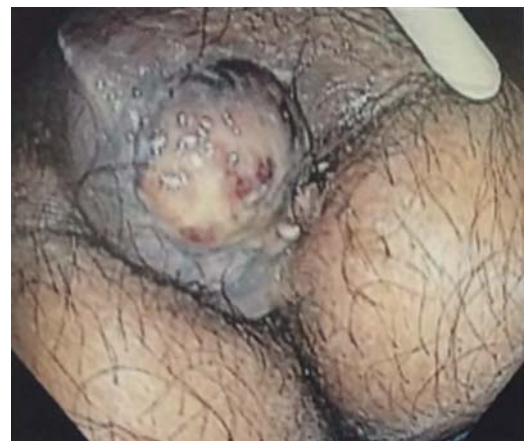
Figura 1. Colonoscopia: lesión perianal.

Fue sometido a exploración y drenaje quirúrgico; se encontró una lesión neoplásica de aspecto melanótico dependiente del recto, con extensión hacia la región perianal, así como áreas con absceso y necrosis. Se realizó drenaje del absceso y resección parcial de la lesión dependiente del recto distal; el espécimen se envió a estudio histopatológico. La colonoscopia con toma de biopsia reveló lesión neoplásica exofítica violácea que se extendía en sentido proximal y obstruía el 90% de la luz del recto distal; se prolongaba hasta los 15 centímetros del margen anal ( Figura 2 ).