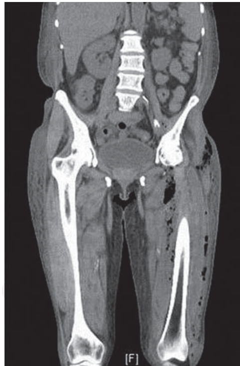
Figura 1: TAC con detección de gas subcutáneo y alrededor de la articulación coxofemoral.

La fascitis necrosante es una emergencia quirúrgica que pone en peligro la vida. Es una enfermedad infecciosa grave, potencialmente mortal que se extiende rápidamente desde el tejido subcutáneo a lo largo de la fascia superficial y profunda causando oclusión vascular, isquemia y necrosis de los tejidos. Las endotoxinas bacterianas con la liberación de citocinas son mediadores de la destrucción rápida de tejido