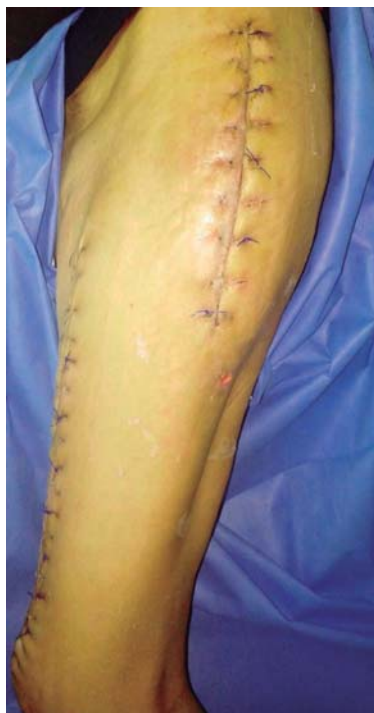
Figura 6: Herida cicatrizada.

los pacientes con fascitis necrosante padecen diabetes mellitus. 5