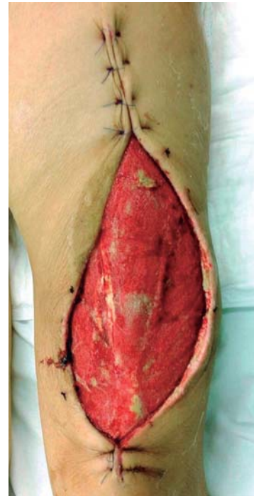
Figura 4: Cierre parcial de herida con tejido de granulación.

La fascitis necrosante se genera por heridas, traumatismos, incisiones quirúrgicas o lesiones menores. Son muchos los factores de riesgo que pueden propiciar la fascitis necrosante tales como la obesidad, condiciones inmunodeprimidas (VIH, abuso de drogas por vía intravenosa), la terapia con corticosteroides y la presencia de enfermedad vascular periférica. Las causas idiopáticas se observan muy a menudo en las poblaciones más jóvenes. 4 Entre 21 y 64% de