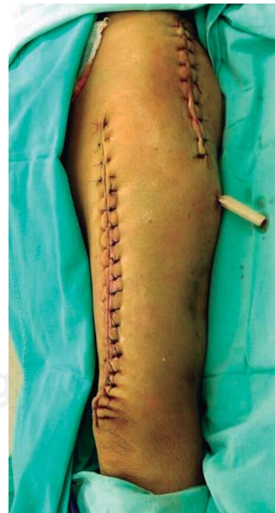
Figura 5: Cierre completo de herida.