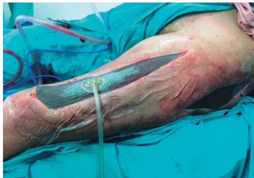
Figura 3: Terapia de presión negativa.

y tienen un papel crucial en la progresión de la enfermedad. 3