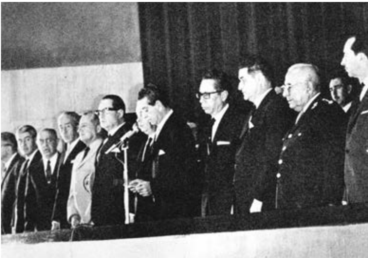
Figura 3: Inauguración del Centro Médico Nacional por el Lic. Adolfo López Mateos, presidente de México.

mente al de la planeación e inicio de la construcción del Centro Médico, pareció vincular, desde sus orígenes, a uno y a otro, no obstante, el Seguro Social nació como un organismo descentralizado del estado, y el Centro Médico se proyectaba como una dependencia de la en-