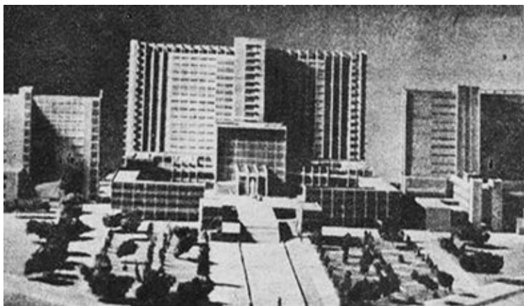
Figura 1: Maqueta de tres de los principales establecimientos de la “Magna Ciudad de la Salud”.

Pero volviendo a la década de los cuarenta, la red hospitalaria planeada por la Secretaría de Salubridad y Asistencia tenía contemplada una construcción especial para la capital del país, un centro médico (impensable para su tiempo) grande y completo, que fuera superior a muchos existentes y en igualdad a otros. Siendo el Dr. Baz ministro de Salubridad y Asistencia (3 de septiembre de 1945) y a un año de terminar su gestión, fue expedida la ley que creó el Comité de Proyección y Construcción del Centro Médico de México. Sus objetivos eran asistir a la población del Distrito Federal y aledaños, con los mayores adelantos de vanguardia médica de su tiempo, reducir costos y mejorar la asistencia social. Esta ley estaría conformada por 12 grandes hospitales con equipo y tecnología moderna que abarcarían todas las ramas de la medicina. Y por nombre llevaría la “Magna Ciudad de la Salud”.