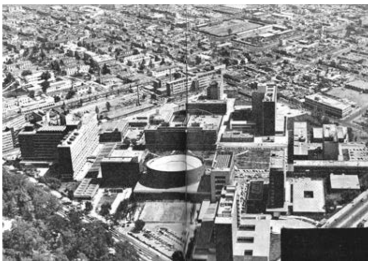
Figura 5: Panorámica final del CMN del IMSS.