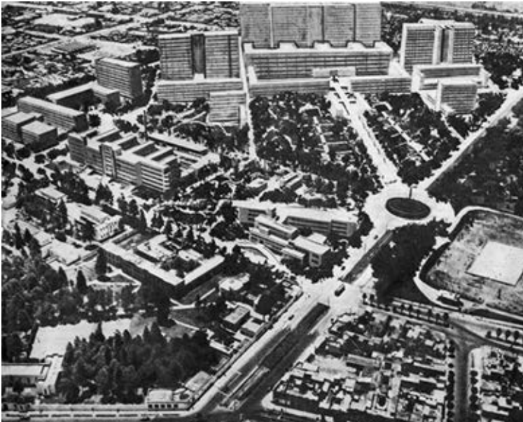
Figura 2: En esta composición fotográfica, se puede observar que el Hospital del Niño y el Instituto de Cardiología ya estaban terminados, y lo que serían varias instituciones médicas que conformarían la “Magna Ciudad de la Salud”.