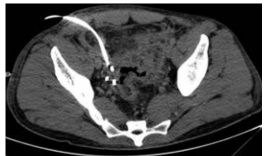
Figura 3: Tomografía que demuestra disminución importante de la colección supravesical.

70 y 120 \text{ cm}^3 purulentos respectivamente. Se dejaron dos drenajes tipo Dawson Mueller® 10.2 fr, uno en fosa iliaca derecha y otro en fondo de saco. Se inició manejo antimicrobiano de amplio espectro con meropenem 1 g iv cada ocho horas y vancomicina 1 g iv cada 12 horas, se dejó en ayuno dos días y se inició apoyo nutricional parenteral durante tres días con oliclinomel®. El cultivo aeróbico desarrolló Streptococcus constellatus sensible a ertapenem, por lo que se cambió cobertura antimicrobiana a base de ertapenem 1 g iv cada 24 horas y vancomicina. El paciente se mantuvo clínicamente estable, sin datos de respuesta inflamatoria sistémica y disminución progresiva del dolor abdominal. Una TAC de control en su tercer día (Figura 3) demostró una disminución importante del líquido en el interior de las colecciones. Se retiró el drenaje derecho en su cuarto día, con un gasto total de 10 \text{ cm}^3 ; los marcadores inflamatorios presentaron una disminución progresiva durante su estancia,