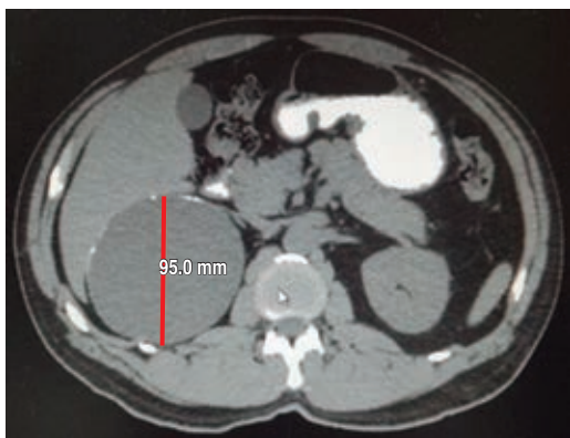
Figura 4: Imagen quística de 95 mm en su eje antero-posterior.

pática y renal, cortisol, aldosterona, calcio, catecolaminas urinarias y metanefrinas. 3 El ultrasonido es por lo regular el primer estudio de imagen empleado en la evaluación de una masa adrenal por su bajo costo y sin exposición a la radiación. Sin embargo, su sensibilidad varía de 66.7 a 90%. En tomografía la sensibilidad es de 85-95% y especificidad de 95 a 100%. La IRM tiene como limitante, a diferencia de la tomografía, baja sensibilidad para detectar calcificaciones. 10 El diagnóstico diferencial de un pseudoquiste adrenal esencialmente incluye todas las lesiones ocupantes de espacio del abdomen superior: quistes hepáticos, esplénicos y renales así como quistes mesentéricos o retroperitoneales y tumores sólidos adrenales. 10 Debe tomarse en cuenta que un diagnóstico preoperatorio de un pseu-