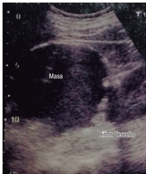
Figura 2: Ultrasonido con imagen de quiste simple, borde hepático inferior derecho.