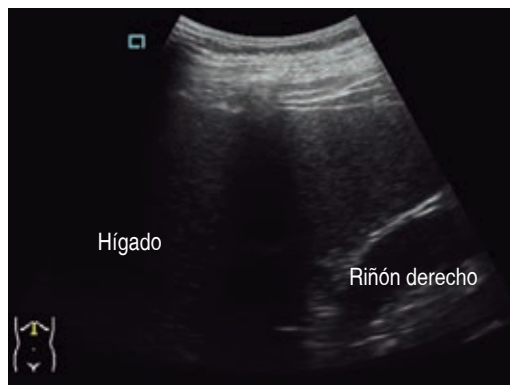
Figura 7: Ultrasonido hepático a los cuatro meses del posoperatorio, parénquima con ecogenicidad homogénea sin evidencia de lesiones focales.

doquiste puede ser en realidad muy difícil debido tanto a sus límites indistintos con los órganos circundantes como a la presencia de adherencias hacia los mismos. 10