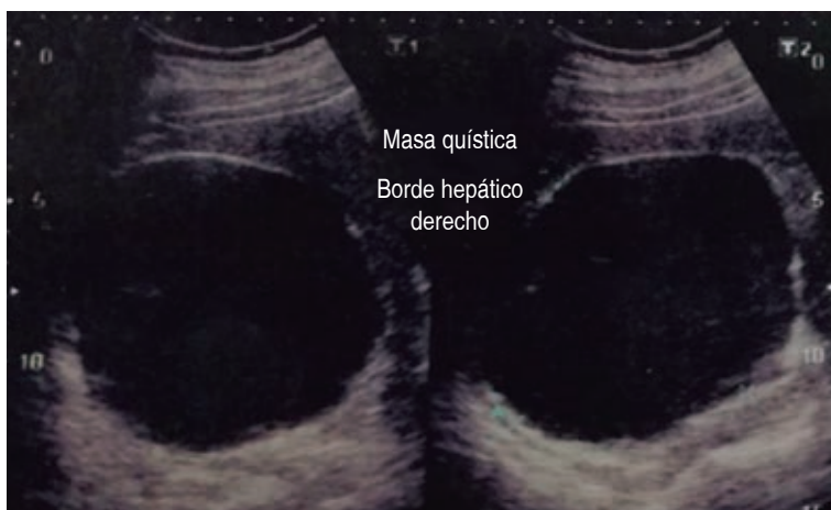
Figura 1: Ultrasonido hepático con imagen anecoica redondeada y de paredes delgadas bien delimitadas.

La mayoría son no funcionales y benignos. El estado funcional de los mismos puede causar síntomas de insuficiencia suprarrenal. El riesgo