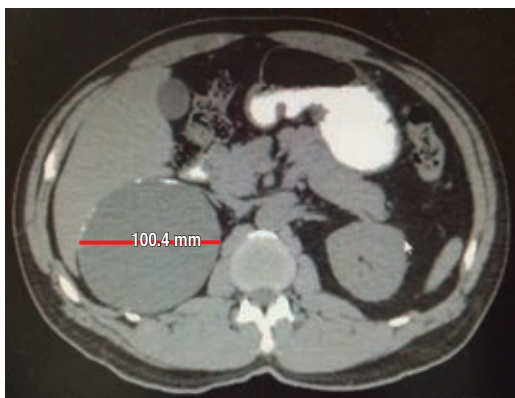
Figura 5: Imagen quística con calcificaciones, diámetro máximo de 100.4 mm.