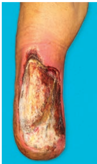
Figura 2: Exposición de tibia y necrosis tisular.

evidenciándose un aumento importante de volumen en el muñón, eritema e incremento de la temperatura local, bordes de la herida quirúrgica macerados y escasas natas de fibrina; se realiza radiografía del muslo, encontrando imágenes sugestivas de gas, por lo que se decide retiro de sutura de forma parcial, drenando 800 cm 3 de líquido seroso, no fétido y presencia de tres trayectos, el mayor de ellos en el compartimento anteromedial del muslo de aproximadamente 15 × 8 × 8 cm (Figura 3). Se realiza toma de cultivo de herida basal sin desarrollo. Por consulta externa se comienzan curaciones mediante irrigación con solución fisiológica al 0.9% durante dos semanas, sin lograr un cierre adecuado; razón por la que se decide implementar manejo con apósitos de PHMB, los cuales se interiorizan en los trayectos, ocupando la totalidad del espacio muerto hasta el borde externo de la herida con previa técnica aséptica (jabón quirúrgico y solución salina estéril), además de desbridar natas de fibrina de los bordes, así como tejido desvitalizado con bisturí; se realizó cambio de los apósitos cada cinco días, observando durante cada curación el cierre de los trayectos con formación de tejido de granulación en dirección proximal a distal; a las cuatro semanas de tratamiento se observó una reducción de 60% del tamaño de la herida