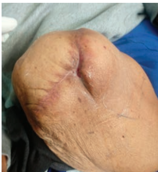
Figura 5: Cierre de la herida a la semana ocho.