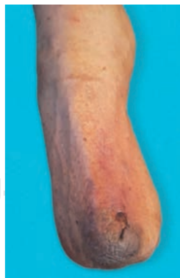
Figura 1: Úlcera superficial.

En agosto de 2019, como consecuencia del traumatismo constante de la prótesis sobre el muñón desarrolla una úlcera ( Figura 1 ), la cual evoluciona de manera desfavorable aumentando la isquemia y presentando necrosis de tejidos blandos y exposición de tibia ( Figura 2 ); razón por la que se presenta al Servicio de Urgencias del Hospital General de México, atendido por el Servicio de Cirugía General, realizando ultrasonido Doppler con reporte de ausencia de flujo arterial distal en 90%, ameritando amputación supracondílea, la cual se llevó a cabo en noviembre de 2019 con los siguientes hallazgos: tejidos blandos sin presencia de infección ni edema, arteria y vena femoral ocluidas por placa de ateroma en 95% de su luz. Recibió antibioticoterapia con amoxicilina/clavulanato 875/125 mg por siete días cada 12 horas. Es egresado al noveno día postquirúrgico; dos semanas después el paciente acude a consulta de seguimiento,