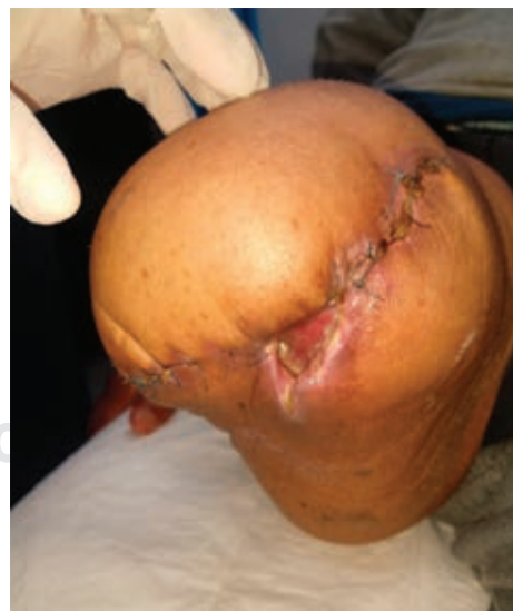
Figura 4: Granulación de la herida a las cuatro semanas de tratamiento con polihexametileno biguanida.