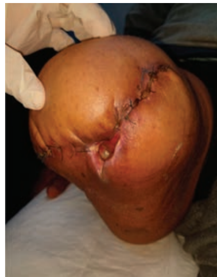
Figura 3: Dehiscencia de la herida quirúrgica, múltiples trayectos que abarcan fascia muscular.

evidenciándose un aumento importante de volumen en el muñón, eritema e incremento de la temperatura local, bordes de la herida quirúrgica macerados y escasas natas de fibrina; se realiza radiografía del muslo, encontrando imágenes sugestivas de gas, por lo que se decide retiro de sutura de forma parcial, drenando 800 cm 3 de líquido seroso, no fétido y presencia de tres trayectos, el mayor de ellos en el compartimento anteromedial del muslo de aproximadamente 15 × 8 × 8 cm (Figura 3). Se realiza toma de cultivo de herida basal sin desarrollo. Por consulta externa se comienzan curaciones mediante irrigación con solución fisiológica al 0.9% durante dos semanas, sin lograr un cierre adecuado; razón por la que se decide implementar manejo con apósitos de PHMB, los cuales se interiorizan en los trayectos, ocupando la totalidad del espacio muerto hasta el borde externo de la herida con previa técnica aséptica (jabón quirúrgico y solución salina estéril), además de desbridar natas de fibrina de los bordes, así como tejido desvitalizado con bisturí; se realizó cambio de los apósitos cada cinco días, observando durante cada curación el cierre de los trayectos con formación de tejido de granulación en dirección proximal a distal; a las cuatro semanas de tratamiento se observó una reducción de 60% del tamaño de la herida