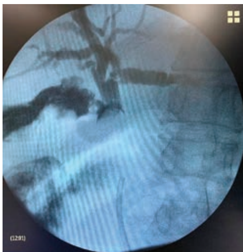
Figura 1: Colangiografía transcística. Se aprecia el defecto de llenado a nivel del conducto colédoco, compatible con síndrome de Mirizzi. Se puede apreciar la endoprótesis distal al sitio de obstrucción.

Mujer de 72 años ingresada en nuestro hospital con diagnóstico de síndrome de Mirizzi. Se realizó una colangiopancreatografía retrógrada endoscópica (CPRE) y la colocación de endoprótesis biliar tipo Ámsterdam de 10 Fr y 10 cm de longitud, en otro hospital. Se intentó una colecistectomía laparoscópica de manera programada, pero debido al proceso inflamatorio severo, se decidió realizar una conversión a colecistectomía abierta. Realizamos una colangiografía transcística, que identificó un defecto de llenado en colédoco ( Figura 1 ). Realizamos coledocotomía, se extrajo el cálculo del colédoco sin necesidad de movilizar la endoprótesis y se practicó una colecistectomía subtotal fenestrada. Se colocó un drenaje a succión cerrada en el espacio subhepático. La paciente desarrolló una fístula biliar de bajo gasto, que se resolvió satisfactoriamente de manera ambulatoria sin necesidad de algún manejo específico. A los