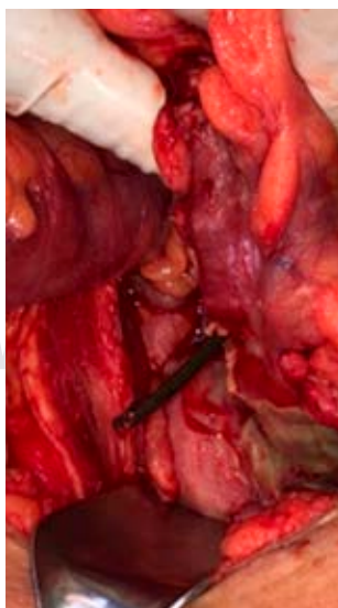
Figura 3: La endoprótesis se observa a nivel del borde antimesentérico del colon sigmoides.

La paciente fue sometida a laparotomía exploradora, se encontró una perforación de un centímetro de diámetro a través de un divertículo del colon sigmoides secundario a la endoprótesis ( Figura 3 ), y múltiples divertículos de sigmoides no complicados. Se extrajo la endoprótesis, se desbridaron los bordes intestinales de tejido sano y se realizó el cierre primario en dos planos, el interno por medio de sutura continua con poliglactina 910 calibre 3-0 y el externo a través de puntos tipo Lembert con seda calibre 3-0. No se evidenció peritonitis localizada o generalizada, pero de cualquier manera se colocó un drenaje de succión cerrada calibre 12 Fr, abocado a corredera parietocólica y pelvis. La evolución postoperatoria transcurrió sin incidentes, se administró ceftriaxona 2 mg cada 24 horas por vía intravenosa y metronidazol 500 mg cada ocho horas; la paciente egresó al cuarto día del postoperatorio, con indicación de cumplir cinco días más de metronidazol 500 mg cada ocho horas por vía oral.