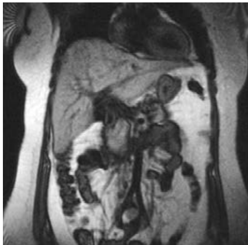
Figura 1: Resonancia magnética nuclear donde se evidencia lesión hepática compatible con hepatocarcinoma de 9 cm aproximadamente en segmento VI y VII.

La serología contra hepatitis A, B y C fueron negativas. La biometría hemática demostró una hemoglobina de 11.4 g/dl, hematocrito 34% y leucocitos 5.5 \times 10^3 \text{ cel/mm}^3 . La química sanguínea tenía como resultados: glucosa 92 mg/dl, nitrógeno ureico 9 mg/dl y creatinina 0.7 mg/dl. El resto de sus pruebas hepáticas fueron las siguientes: aspartato transaminasa (AST) 25 UI/l, alanino transferasa (ALT) 95 UI/l y fosfatasa alcalina (ALP) 100 UI/l.