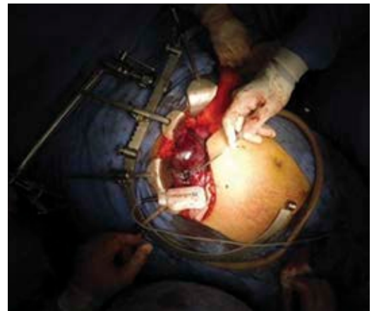
Figura 2: Tumoración hepática descrita que es resecada con apoyo de Habib 4x.

Se decide intervenir quirúrgicamente, se efectúa resección de la lesión en segmento V y VIII, utilizando sistema de energía Habib 4x device (AngioDynamics, N.Y, U.S)®, colecistectomía y biopsia de tejido hepático sano con sutura crómico del 0, con un tiempo quirúrgico de 160 minutos, mediante incisión subcostal bilateral sin maniobra de Pringle, el cierre se realizó con Vicryl→ del 1 con surjete continuo en dos tiempos para la aponeurosis y Derma-lon→ 3-0 para la piel con puntos simples, se colocó drenaje tipo Penrose de 1/4" dirigido al lecho hepático (Figuras 2 y 3).