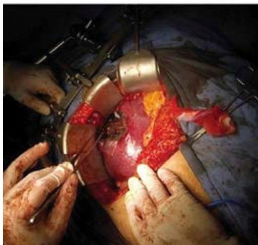
Figura 3: Área de resección de tumoración hepática. Hígado de aspecto macroscópico sano.

La cirrosis hepática es el principal factor de riesgo de CHC; sin embargo; cierto número de CHC se presenta en hígado no cirrótico, con una proporción de casos menor de 20%, convirtiéndolo así en una patología poco común. El CHC en hígado no cirrótico tiene características epidemiológicas, clínicas, manejo terapéutico