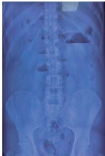
Figura 1: Radiografía abdominal. Niveles hidroaéreos y ausencia de gas distal.

nedas, así como distensión de asas del intestino delgado, con ausencia de gas en intestino distal.