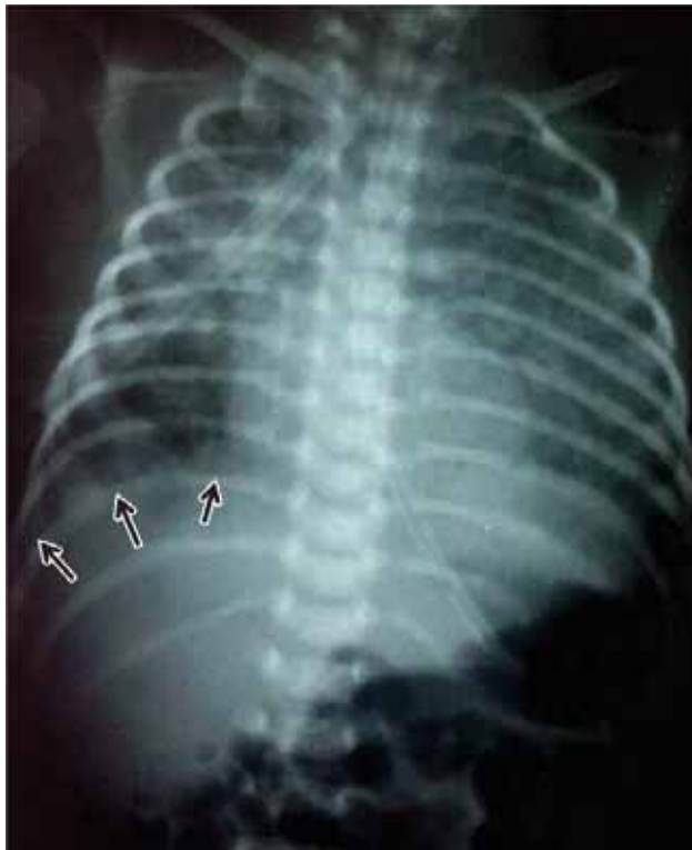
Figura 4. Control radiológico postoperatorio inmediato; se visualizan ambos hemitórax a un mismo plano.

con 37 de vida se le realiza toracotomía derecha y plastia diafragmática; Cirugía Pediátrica reporta en los hallazgos eventración diafragmática sin alteraciones visuales en la estructura muscular. Al control radiológico se visualiza el diafragma en un mismo plano (Figura 4), los ángulos del colon en situación anatómica normal y el hígado parcialmente en cavidad abdominal. Se deja sonda pleural para drenaje; progresivamente, los parámetros del ventilador disminuyen; se requiere vancomicina e imipenem por neumonía asociada a ventilador. Se alimenta para ese entonces con fórmula para recién nacido de peso bajo. Doce días después de la cirugía se extuba sin contratiempos (49 días de vida).