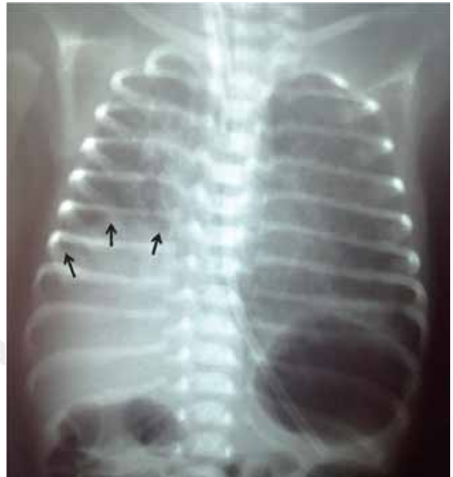
Figura 2. Radiografía de tórax a los 25 días; persiste la cúpula diafragmática elevada a dos arcos costales de diferencia del contralateral.