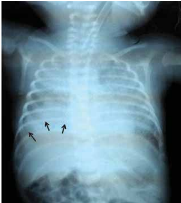
Figura 1. Radiografía de tórax al cuarto día de vida; se aprecia la elevación diafragmática.