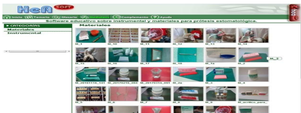
Fig. 3. Mediateca