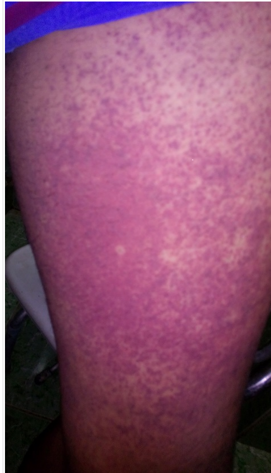
Figure 1. Photograph of the patient's left thigh showing intense vasculitis due to dengue.

The fever subsided two days after admission, and the skin rash, which had become petechial, after the fever disappeared became ecchymotic ( Figure 1 ). The patient maintained a persistent dry cough to changes in position and, on the fourth day of hospitalization, he presented lipothymia and extreme bradycardia (38 bpm), for which he was transferred to the intensive care unit; there, oxygen was administered through a nasal catheter and he was treated with dobutamine, but it was not necessary to maintain this drug due to having a discrete hypertensive reaction (BP 160/90 mmHg), which is why a treat-