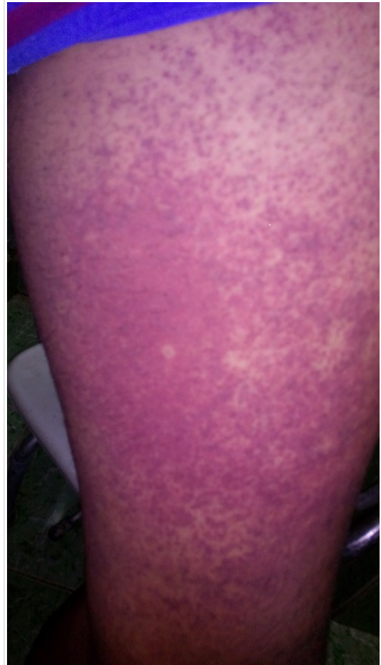
Figura 1. Fotografía del muslo izquierdo del paciente donde se evidencia la intensa vasculitis por dengue.

La fiebre cedió dos días después del ingreso y la erupción cutánea, que se había hecho petequial, luego de desaparecer la fiebre, se hizo equimótica ( Figura 1 ). El paciente mantuvo tos seca persistente a los cambios de posición y, al cuarto día de hospitalización, presentó lipotimia y bradicardia extrema (38 lpm), por lo que fue trasladado a la unidad de cuidados intensivos; donde se le administró oxígeno por catéter nasal y fue tratado con dobutamina, pero no fue preciso mantener este fármaco por tener