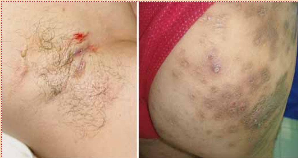
Fotografía 3. En una axila presencia de nódulos, quistes y fistulas. Uno de los glúteos con lesiones múltiples nódulo-quísticas, pústulas y cicatrices hiperpigmentadas.