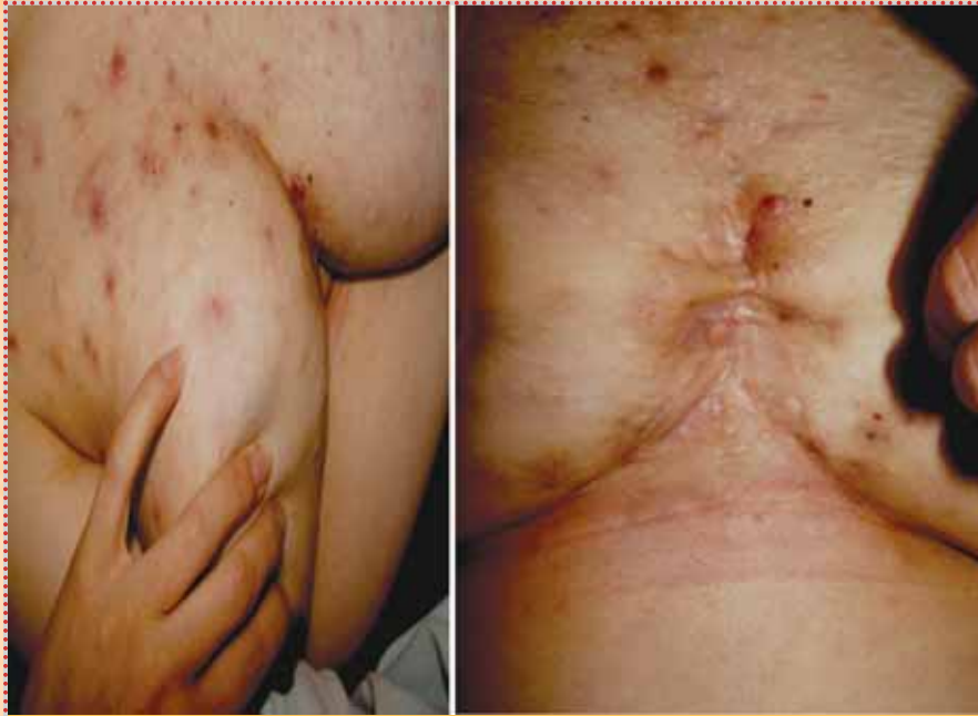
Fotografía 2. Acné inflamatorio severo en piel del tronco anterior y quiste pilonidal con cicatrices “en puente” en piel supraesternal.