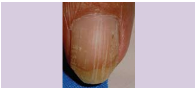
Fotografía 20. Fisuras y estrías longitudinales.