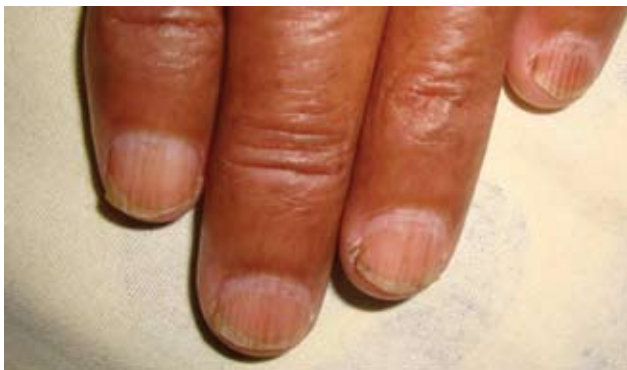
Fotografía 2. Onicorrexis discrómica por tinte de pelo.