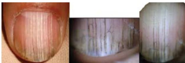
Fotografía 3. Onicorrexis discrómica por aceite quemado: aspecto dermatoscópico de la lesión.