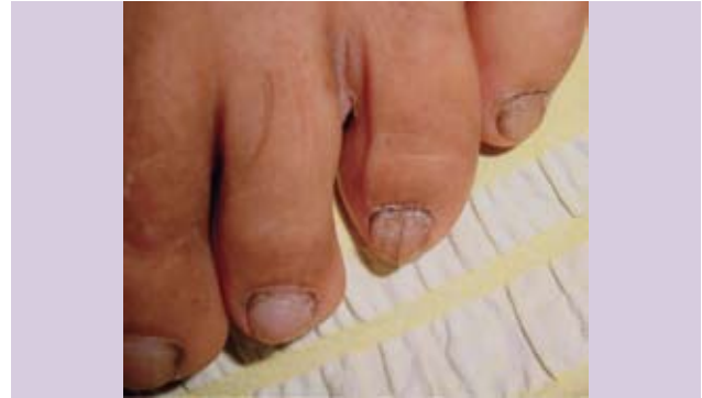
Fotografía 15. Línea longitudinal acanalado con tierra.