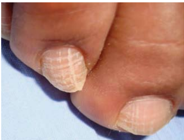
Fotografía 32. Líneas longitudinales y transversales semejando un cuadrículado.

Para el diagnóstico de las alteraciones de la superficie del plato ungueal se deben tomar en cuenta: la edad, el cuadro clínico, la ocupación, y cualquier tipo de noxa que pueda afectar al paciente.