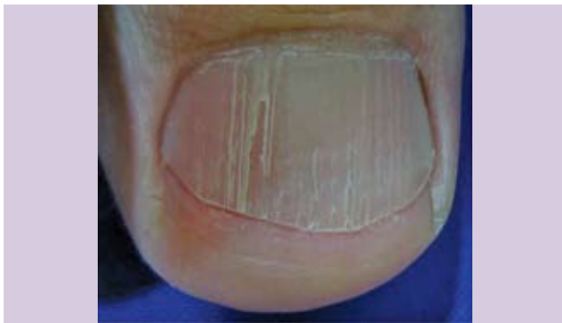
Fotografía 19. Fisura y estrías longitudinales en cadena.