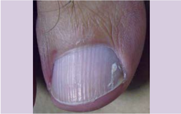
Fotografía 12. Onicorrexis y onicomiosis blanca superficial en primer ortejo derecho.

El piqueteado, o los hoyuelos, se definen como pequeñas erosiones en la superficie de la uñas. 8 También se denomina oniquia puntata , y erosiones o depresiones de Rosenau. Estas últimas se deben a la presencia de pocos hoyuelos irregularmente distribuidos que pueden presentarse en asociación con enfermedades infecciosas. 10