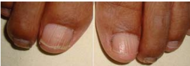
Fotografía 13. Onicorrexis en ambos primeros ortejos.