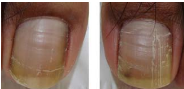
Fotografía 26. Surcos transversales y fisura longitudinal.