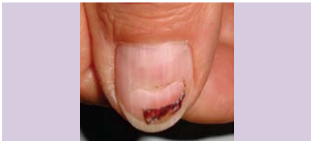
Fotograf3a 8. Surco transverso traum3tico.

El plato ungueal es duro, el3stico, flexible, resistente, de color rosado, y transparente, de modo que se pueda ver la vascularizaci3n del lecho ungueal y su porci3n semilunar blanquecina llamada l3nula. Presenta una porci3n