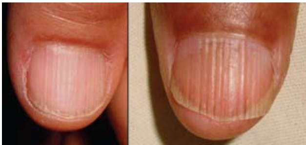
Fotografía 1. Onicorrexis superficial y profunda.

Las uñas de las manos pueden usarse como herramienta para realizar diferentes funciones, para prender, para proteger, tocar, como elemento estético, e incluso como arma de defensa; las de los pies fungen como protección,