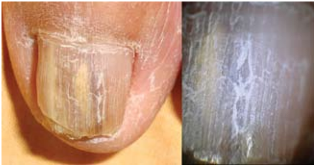
Fotografía 18. Fisura lineal; aspecto dermatoscópico de la lesión.

dos a psoriasis; 1 la presencia de hoyuelos de igual tamaño entre 1 a 1.5 mm, redondos como pequeñas bolas, son típicos de uñas psoriáticas, junto con la onicólisis y las estrías longitudinales. Más de veinte hoyuelos en las uñas de los dedos de las manos pueden ser sugestivos de psoriasis. La onicomicosis ocasionalmente puede presentar algunos hoyuelos profundos. 10