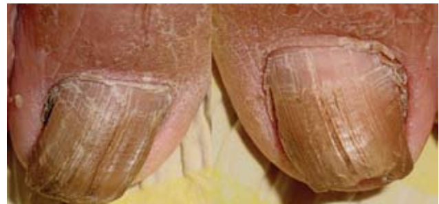
Fotografía 16. Líneas longitudinales finas y acanaladas en ambos primeros ortejos.