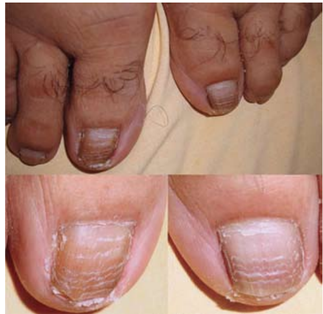
Fotografía 22. Múltiples líneas de Beau, secundario a quimioterapia por linfoma.