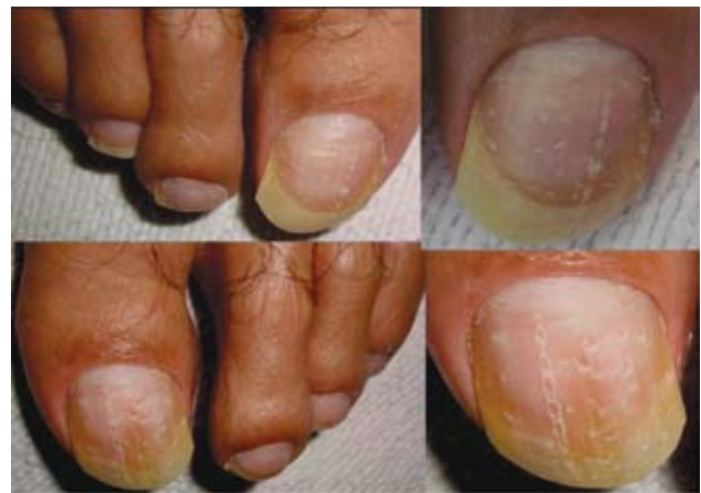
Fotografía 17. Líneas longitudinales en forma de cadena, y depresiones en la superficie de ambos primeros ortejos.