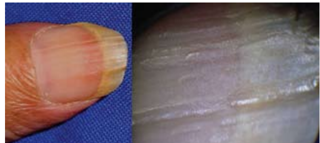
Fotografías 4, 5, 6. Onicorrexis con el aspecto dermatoscópico de la lesión.