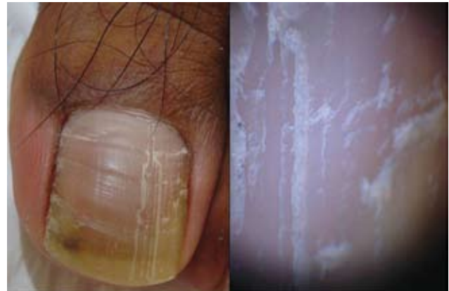
Fotografía 27. Acercamiento de la fisura longitudinal; aspecto dermatoscópico de la lesión.