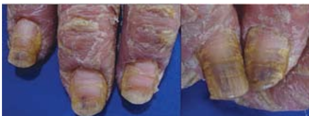
Fotograf3a 11. Surcos transversales por eritrodermia psori3sica.

superficial y una profunda. La superficial proviene de la matriz proximal, formada de c3lulas aplanadas estrechamente adheridas; la profunda se origina de la matriz distal y est3 constituida por c3lulas menos adheridas.