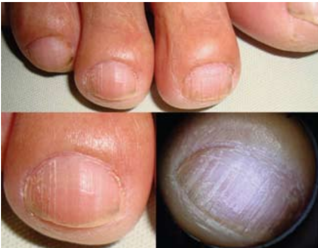
Fotografía 14. Estría longitudinal fisurada y su aspecto dermatoscópico.