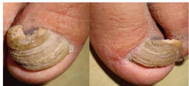
Fotografía 29. Estrías longitudinales en onicogriphosis.