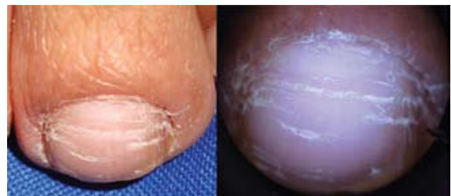
Fotografía 23. Surcos transversales; aspecto dermatoscópico de la lesión.