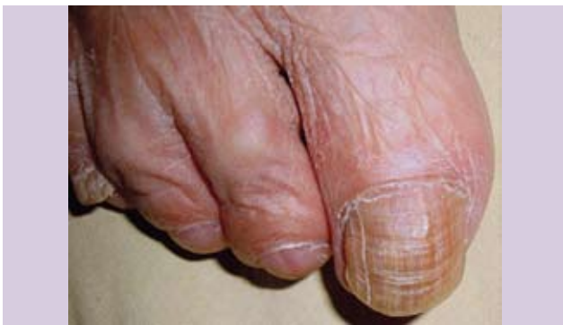
Fotografía 25. Surco longitudinal y transversal en el primer ortejo del pie derecho.