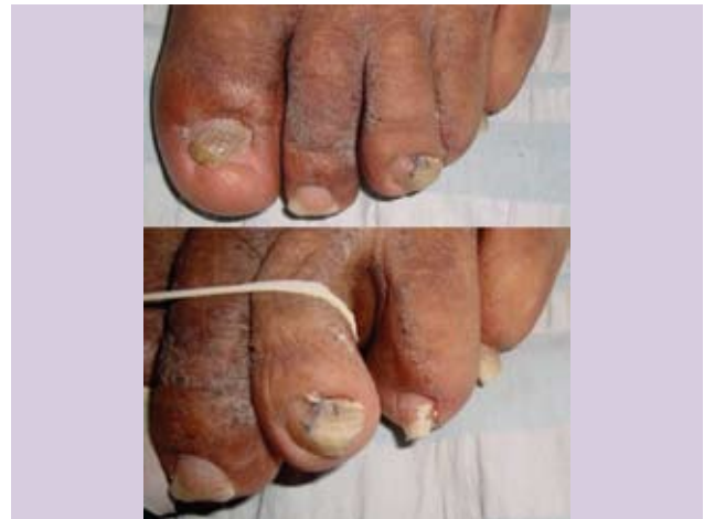
Fotografía 28. Estría longitudinal y onicomicosis blanca superficial.