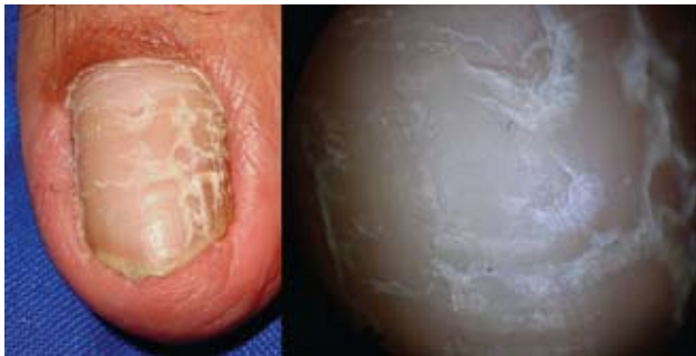
Fotografía 24. Surcos transversales y longitudinales fisurados; aspecto dermatoscópico de la lesión.

a un trauma repetido, que disminuye la adherencia entre las capas de las uñas; a humedad constante de las manos; a sustancias químicas ácidas o básicas, así como a detergentes y a la vejez. En el nivel proximal puede ser debida a psoriasis, liquen plano, y terapia con retinoides orales. De 27% a 35% de estas divisiones lamelares, u onicosquicia, puede ser normal en mujeres adultas. 1