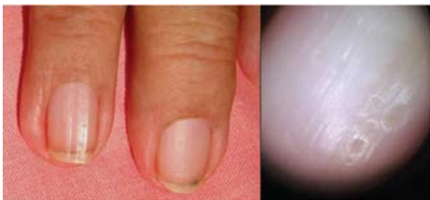
Fotograf3a 10. Surco longitudinal 3nico y piqueteado; aspecto dermatosc3pico del piqueteado.