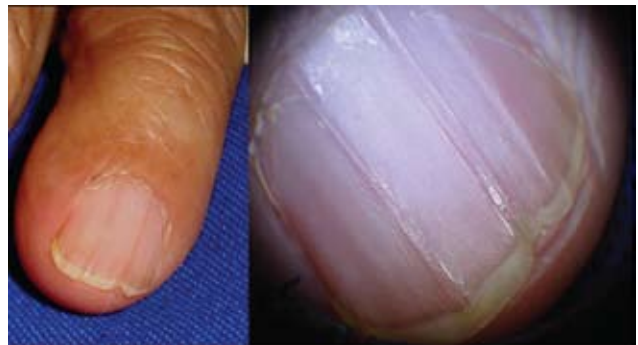
Fotografía 7. Estrías longitudinales con onicosquicia: aspecto dermatoscópico de la lesión.