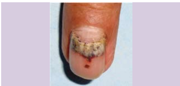
Fotograf3a 9. Onicomadesis secundario a trauma y hematoma subungueal.