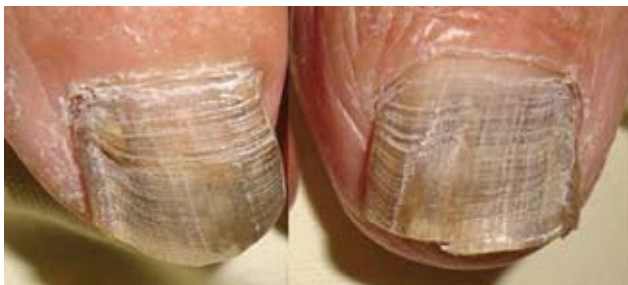
Fotografía 31. Múltiples surcos transversales y algunos longitudinales.