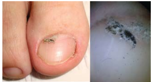
Fotografía 8. Pliegue lateral de la uña después de la remoción del material.