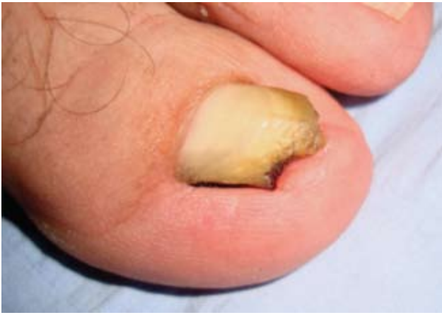
Fotografía 3. Vista lateral y acercamiento de la lesión.