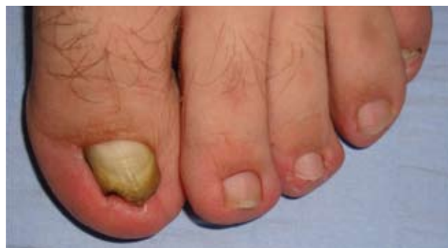
Fotografía 1. Vista panorámica de la discromía del pliegue lateral del primer ortejo izquierdo.

Se informan estos casos con discromía subungueal del pliegue lateral, dado que simulan una melanoniquia longitudinal cuando el hilo del calcetín es de color negro.