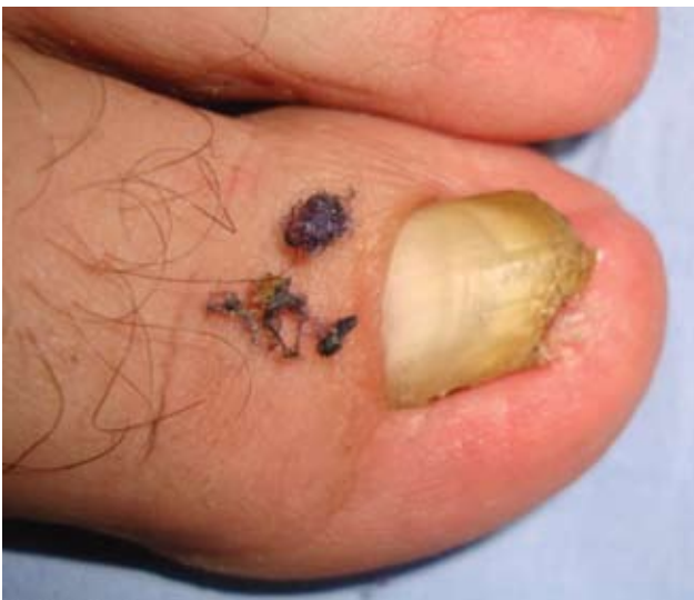
Fotografía 5. Pliegue lateral de la uña después de la remoción de los hilos del calcetín.