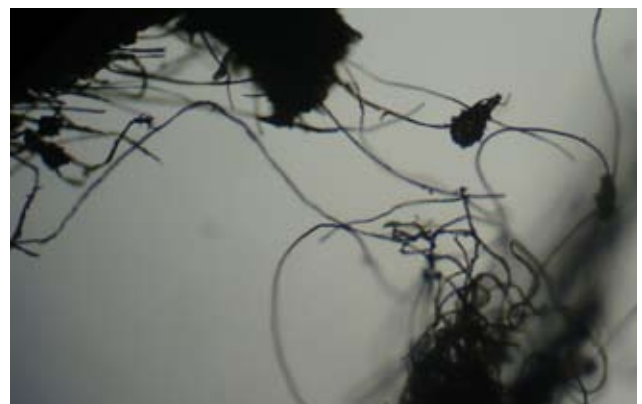
Fotografía 9. Aspecto microscópico de los hilos del calcetín.