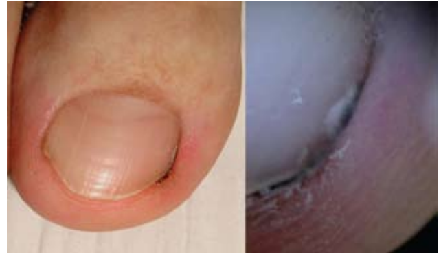
Fotografía 7. Aspecto clínico y dermatoscópico del hilo del calcetín.