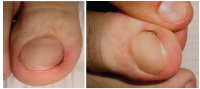
Fotografía 6. Vista panorámica de leve discromía negruzca en el pliegue lateral del primer dedo derecho.