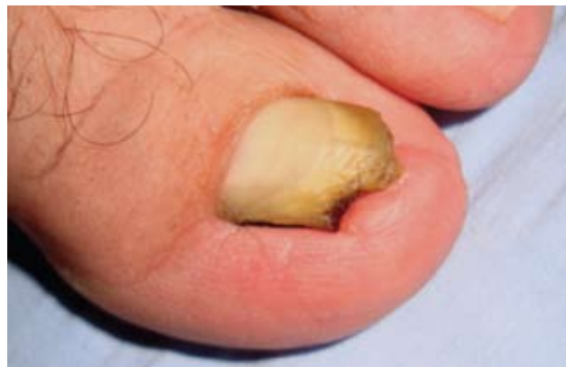
Fotografía 2. Vista lateral y acercamiento de la lesión.