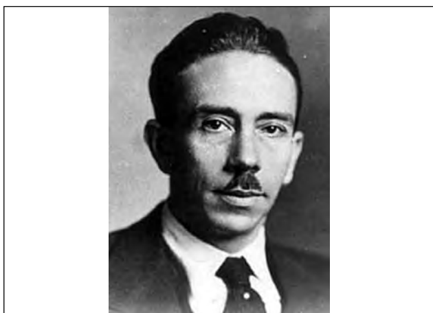
Ilustración 1. Doctor Gustavo Baz Prada.

En estas condiciones, siendo director de la facultad de Medicina, en unas vacaciones en Acapulco, tomando un descanso, en alguno de los días que me tocó estar solo a la orilla del mar, comencé a hacer recuerdos de mis años de estudiante, con todas las dificultades que había tenido entre mi pobreza, recordando como en el momento de terminar los estudios le quitaban a uno el puesto de practicante y todavía no le daban el de médico; así se pasaban días angustiosos, mientras se preparaba la tesis y el examen profesional. Al mismo tiempo medité en la atención médica de los campesinos de la República, la falta total de asistencia médica y todavía más, pensé en que es frecuente que los funcionarios lleguen a serlo sin el conocimiento real del campo. Motivado por estos pensamientos, elaboré tres instructivos: uno para los jóvenes que irían con los campesinos, otro para los jóvenes que irían a la industria y otro más para los jóvenes que irían a las minas. Estos instructivos tenían por objeto guiar al pasante a ver las cosas con espíritu analítico cuidadoso, que tuvieran información del medio en que vivían, estando atentos a todos los factores que les rodearan, así cada uno de los jóvenes que salieran al Servicio Social para pasantes de Medicina iban a cumplir tres muy importantes misiones: 1) atender a los enfermos que nunca habían tenido asistencia