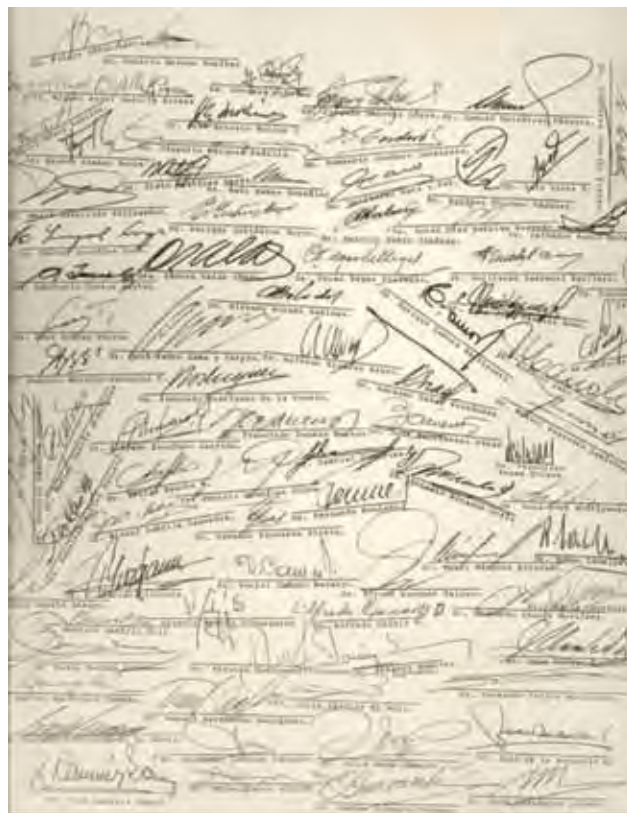
Ilustración 3. Documento con las firmas los integrantes de la generación 1931-1937 antes de partir al Servicio Social.