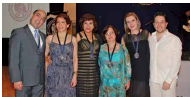
Mesa directiva de la Academia Mexicana de Dermatología.