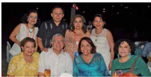
Grupo de entusiastas congresistas.