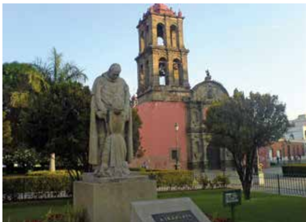
Templo del “Hospitalito”.