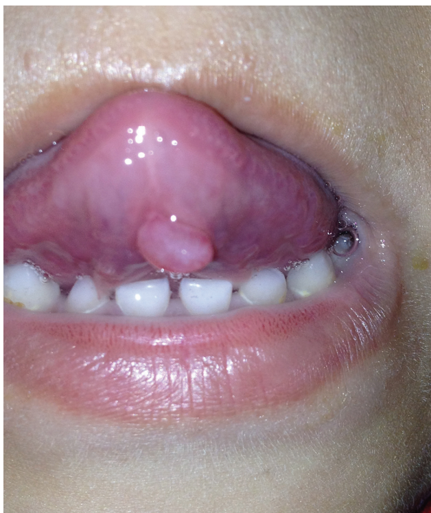
Figura 1. Foto clínica. Se observa neoformación hemiesférica, translúcida en cara ventral de lengua.

Niña de tres años de edad, originaria y residente de la Ciudad de México. Presenta lesión localizada en cara ventral de lengua, en línea media, caracterizada por neoformación única, pediculada de 1.2 cm de diámetro, del color de la mucosa, superficie lisa, consistencia renitente, prueba de transiluminación positiva, dos meses de evolución, asintomática y con crecimiento progresivo. Sin tratamientos previos. No refirió evento desencadenante.