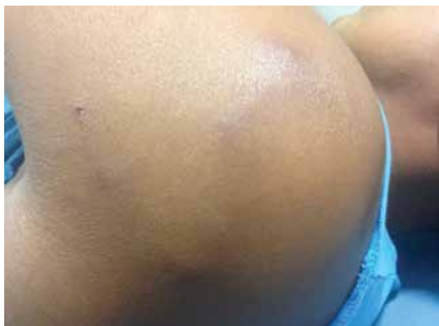
Foto 1. Se observa dermatosis conformada por trayecto serpinginoso, eritemato-edematoso.

Hombre de 32 años de edad, originario y residente de la Ciudad de México, presenta una dermatosis localizada en la región deltoidea izquierda, caracterizada por una placa eritematosa, edematosa con un borde serpinginoso, ligeramente elevado e indurado, piel suprayacente de coloración eritemato-violácea. Evolución de un mes, es pruriginosa, refiere que inició con lesión papular, eritematosa, que ha migrado progresivamente. Cuenta con antecedente de infección por VIH.